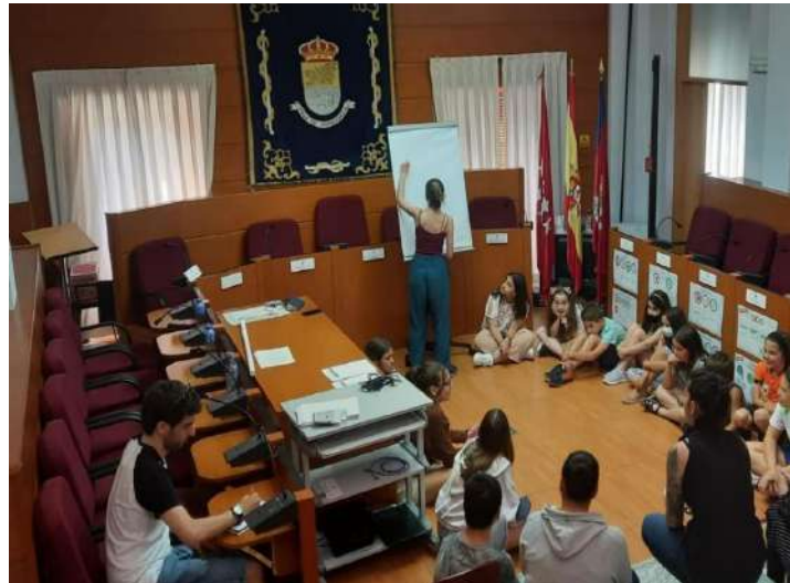
Imagen 1. Primera reunión del Consejo Local de Infancia y Adolescencia de Moralarzaral

La primera etapa de este proceso consistió en la elaboración de un diagnóstico sobre la situación de la infancia y la adolescencia en el municipio. El objetivo principal de este diagnóstico era el de identificar las principales problemáticas y necesidades que atraviesan a esta población, y poder de esta manera construir un Plan Local verdaderamente útil y acorde a las realidades de la infancia y adolescencia de Moralarzaral.