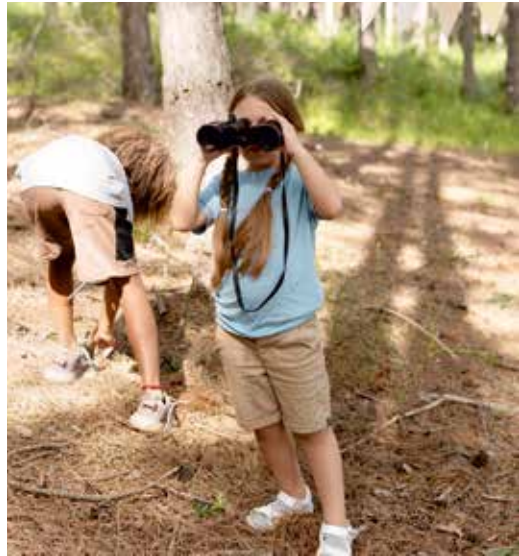
gráfico y realidad aumentada, a la vez que realizan gymkhanas programadas y diseñadas por ellos mismos o se dan un baño refrescante en la piscina municipal, como colofón final del último día de campamento. El objetivo es poner a prueba su capacidad de trabajar en equipo con las nuevas tecnologías.

Cada día, los jóvenes se enfrentarán a nuevos desafíos tecnológicos que deben superar: programación, robótica, inteligencia artificial, diseño