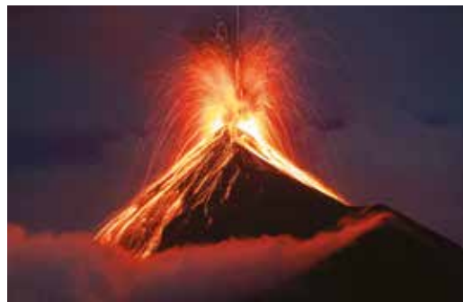
Óscar Díez Martínez, tercer clasificado con “Volcán de fuego”. Premio de 100 €.