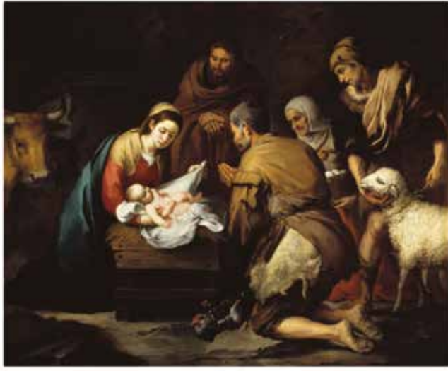
La adoración de los pastores (Bartolomé Murillo Esteban)

En estos días tan especiales desde el Partido Popular de Moralzarzal os deseamos que disfrutéis de nuestras tradiciones con familia y amigos. Feliz Navidad !!! y que el recibo de la luz no te impida que ilumines estas fechas.