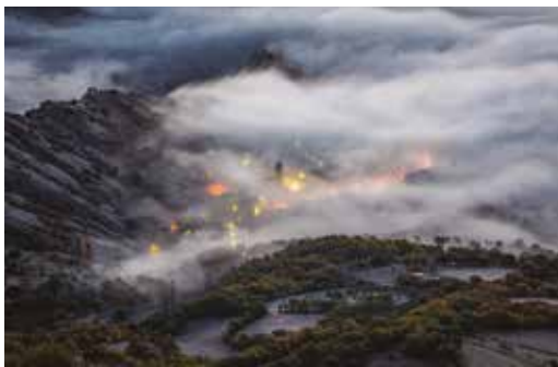
Jesús Pugmartí, segundo clasificado con “El abrazo de la niebla”. Premio de 300 €.

A esta edición del concurso de Fotografía de Montaña se han presentado un total de 266 imágenes.