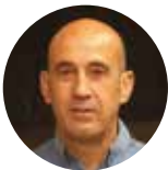
Miguel Ángel Soto Autor

SORCAS PODRÁ ACOMETER LAS REPARACIONES NECESARIAS DE SU VIEJO SALÓN DE BAILE, CONSTRUIDO EN 1929, GRACIAS A LA FINANCIACIÓN DE LA EDICIÓN DE UN LIBRO DE CONMEMORACIÓN DE SU CENTENARIO POR PARTE DEL AYUNTAMIENTO