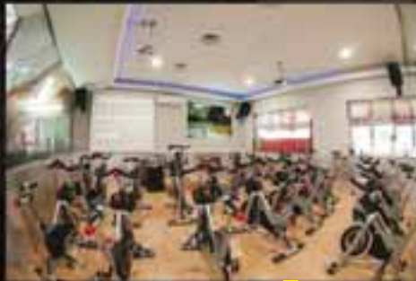
▶ SALAS CON TECNOLOGÍA AUDIOVISUAL