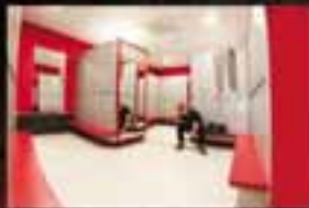
▶ MODERNAS INSTALACIONES