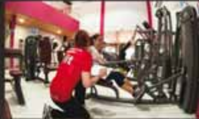
▶ MONITORES CON ALTA CUALIFICACIÓN