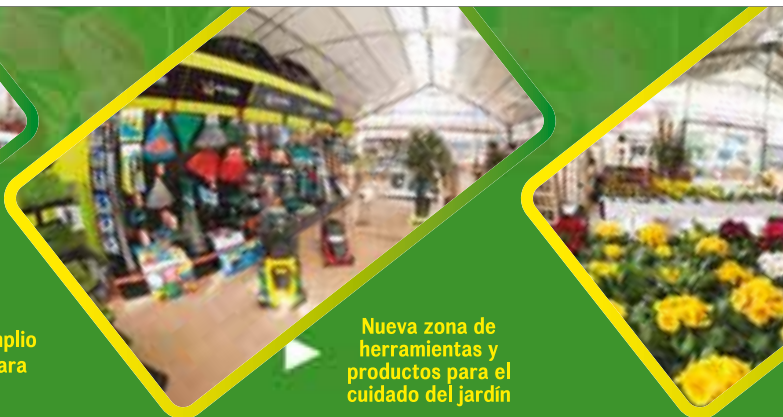
Nueva zona de herramientas y productos para el cuidado del jardín