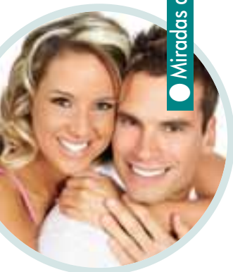
Miradas de amor

Los Talleres están organizados por la Concejalía de Servicios Sociales de Moralarzal y la THAM, con el objetivo de implementar acciones que fomenten y promuevan valores de cooperación, tolerancia e igualdad. Todos los talleres tendrán un máximo de 20 plazas y un mínimo de 10. Inscripciones, en el Centro de Servicios Sociales, calle Iglesia, 5.