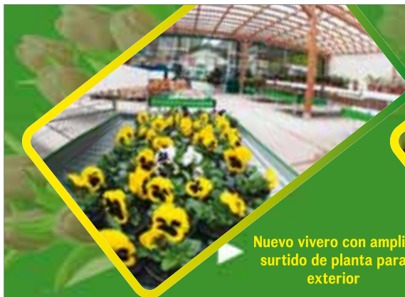
Nuevo vivero con amplio surtido de planta para exterior

El II Torneo de Fútbol Sala llevado a cabo en fechas navideñas se convirtió en todo un éxito, tanto en la participación e involucración por parte de los participantes como por el número de asistentes que acudieron para animar y disfrutar de una emocionante final.