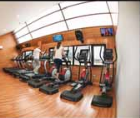
▶ MAQUINARIA DE ÚLTIMA TECNOLOGÍA