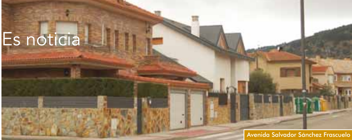
Avenida Salvador Sánchez Frascuelo

11 vecinos serán indemnizados con 1.000 euros cada uno por exceso de ruido