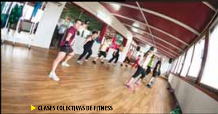
▶ CLASES COLECTIVAS DE FITNESS

En un mundo donde la salud, el bienestar y la estética encabezan las prioridades de las personas, Bfit-Moralzarzal ha utilizado toda su experiencia para ofrecértelo en las mejores condiciones.