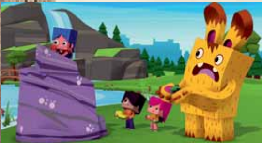
YOKO Y SUS AMIGOS de I. Berasategui, J. Elordi y R. Gilmetdinov Domingo 13, a las 12 horas