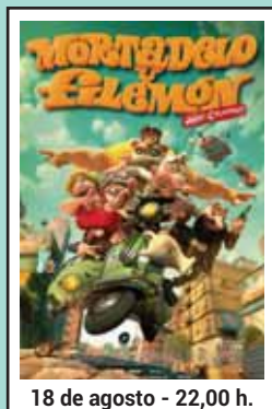
18 de agosto - 22,00 h.