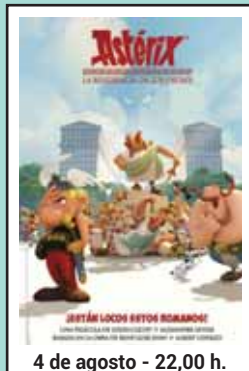
4 de agosto - 22,00 h.