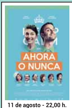
11 de agosto - 22,00 h.