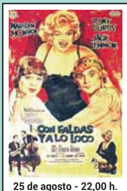
25 de agosto - 22,00 h.