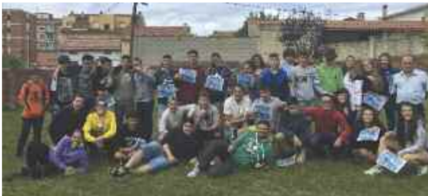
SURFCAMP2017. Más de 30 jóvenes disfrutaron de una semana de Surf y actividades deportivas en Asturias.

Más info en la Casa de Juventud o siguiéndonos en las redes sociales con @JuventudMoral.