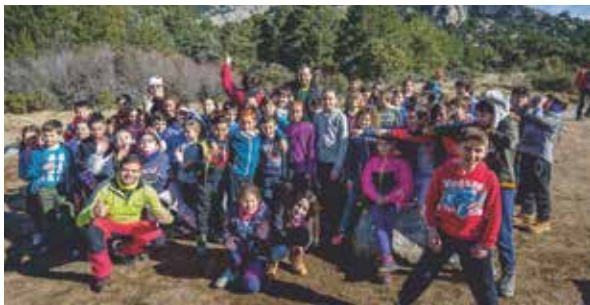
Juventud Junior en La Pedriza