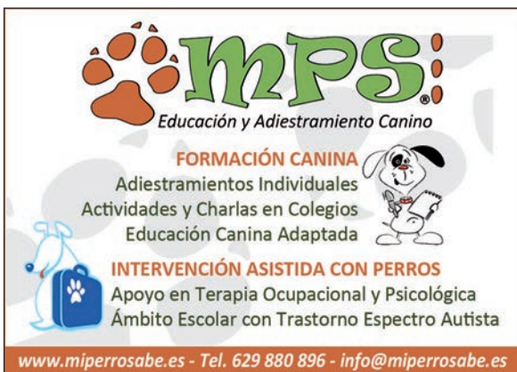
Ilustración: Juanma Rodríguez