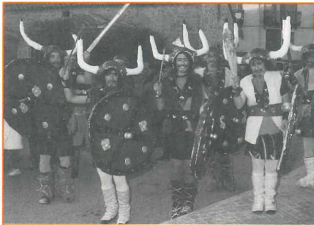
La tradición carnalera en Moralarzal es grande

Todo está ya listo para que Don Carnal haga su aparición un año más, como ya es tradición en Moralarzal desde hace mucho tiempo. La Asociación de Carnaval "Amigos de la Juega", encargada de organizar los actos, ha previsto los siguientes temas centrales para los disfraces de este año: