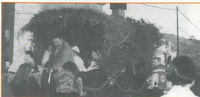
Una de las carrozas que formó este año la Cabalgata

Abrían el desfile por las principales calles del pueblo dos jinetes a caballo, ataviados a modo de la antigua guardia. La primera carroza, realizada por la Asociación de Carnaval, representaba el Belén viviente, con sus correspondientes pastorcillos; quedó muy original. La segunda, también con niños-pastores, fue realizada amablemente por personas de la urbanización Los Morales, y portaba la Estrella que guiaba a los Reyes Magos a Belén. En las tres siguientes, iban montados los Reyes Magos - que, este año, estrenaban sillones, donados por un simpatizante de nuestra localidad-, acompañados por sus correspondientes pajes. Cada carroza fue adornada por un grupo de colaboradores del pueblo de Moral.