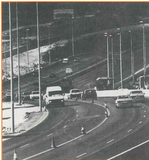
Los vehículos son los grandes contaminantes

¿Por qué se están produciendo estas irregularidades en las lluvias y en las temperaturas? Puede ser debido a causas naturales -cambio climático, variaciones en las dimensiones de las manchas solares, etcétera-, contra las que nada puede hacer el hombre, o artificiales -contaminación atmosférica producida por coches, calefacciones o centrales térmicas, contaminación de los mares y destrucción de los bosques y desertización. Solamente en la guerra del Golfo se quemaron millones de toneladas de petróleo, con lo que se produjo una gran contaminación atmosférica. En éstas sí puede actuar el hombre. Todos hemos visto, a veces, esa "sombrija" sobre el cielo de Madrid. Eso es la contaminación atmosférica e impide la renovación del aire, así como la posible entrada