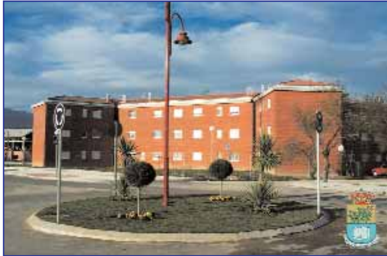
El Ayuntamiento ha construido ya 90 viviendas de promoción municipal

La explicación es sencilla: el suelo en el que se quieren ubicar las viviendas sería municipal, con lo que los interesados no tendrían que pagarlo a precio de mercado; y el promotor sería el propio