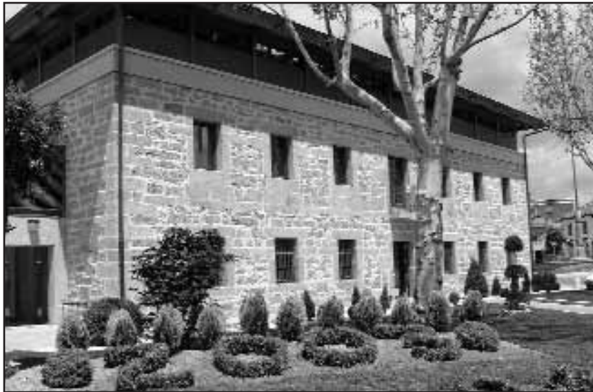
Biblioteca Municipal "Casa Grande"

La Corporación, por mayoría de los miembros que por derecho la componen, constatándose el voto a favor de los Sres. Concejales del grupo P.P., y el voto en contra de los Sres. Concejales del grupo P.S.O.E. y del grupo P.D.D.M., acuerda: aprobar la recepción y liquidación de las obras de ejecución de nueva Biblioteca Municipal por un importe total de 436.057,40 euros, representando un cien por cien del Proyecto contratado.