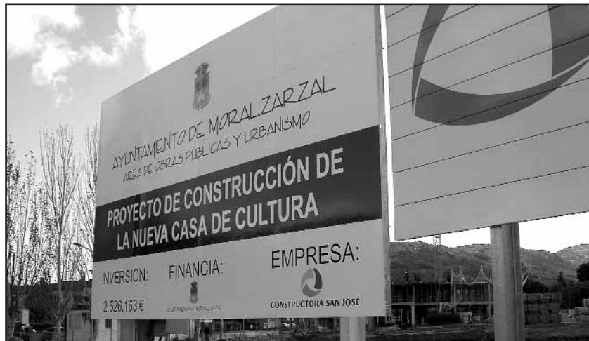
La nueva Casa de Cultura está en marcha

● OBRAS DE EJECUCION DE NUEVA CASA DE CULTURA. La Corporación, por mayoría absoluta de los miembros que por derecho la com-