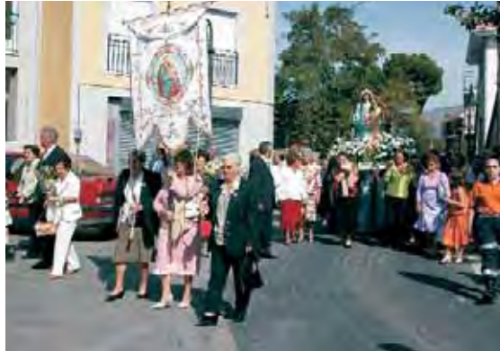
PROCESIÓN. Todo comienza con la Misa y procesión en honor de nuestros Patronos, la Virgen del Rosario y San Miguel Arcángel. Abajo vemos una imagen de los talleres para niños, que han disfrutado de numerosas actividades, y el multitudinario desayuno que se ofrece a los mayores.

Las Fiestas Patronales se celebraron entre el 29 de septiembre y el 5 de octubre. Como siempre, la participación popular fue la característica más destacada. Les ofrecemos algunas imágenes.