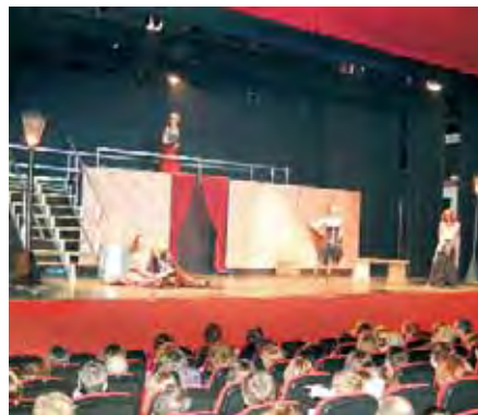
"Top Broadway" culminó el éxito de Otoñal 2005 con otro lleno