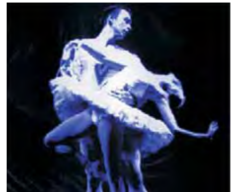
Primer lleno con "El Lago de los Cisnes"