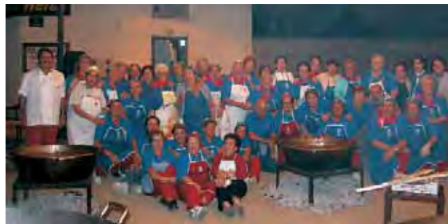
COMIDA Y CENA. Callos con garbanzos en la comida del lunes y la estupenda caldereta, en la que como siempre participan numerosas voluntarias de la localidad, como fin de fiestas.