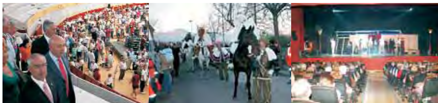
UNA PLAZA DE TOROS ESPECTACULAR. Se inauguró la Plaza de Toros Cubierta, una instalación única en la Comunidad de Madrid. ACTIVIDADES NAVIDEÑAS. Las Áreas de Cultura y Juventud han preparado un amplio programa de actividades para Navidad. OTOÑAL 2005 ARRASÓ. Gran éxito de la Concejalía de Cultura con la primera edición.