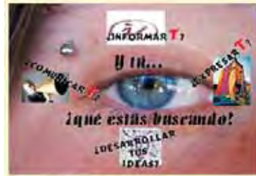
Los Viernes Activos han vuelto y están teniendo una gran participación

También se proyectan programas de radio por internet. Los jóvenes interesados en hacer un programa pueden ponerse en contacto con la Casa de Juventud.