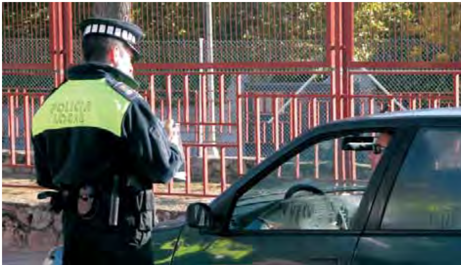
La Policía Local de Moralarzarzal se sumó a la campaña de control del uso del cinturón