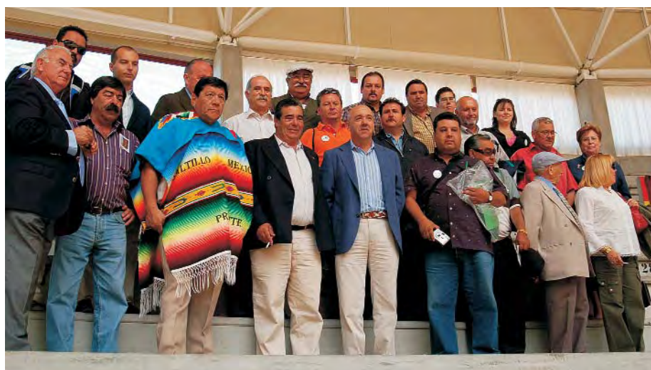
Los participantes en el I Encuentro Mundial de Aficionados Taurinos Madrid 2006 posan en las gradas de la Plaza de Toros Cubierta de Moralarzarzal.

Moralzarzal ofreció la recepción oficial de este I Encuentro Mundial, que organizó la Federación Taurina de Madrid. Los participantes visitaron la Plaza de Toros Cubierta el 1 de junio y conocieron de primera mano lo que la Federación considera un "ejemplar modelo de gestión municipal, en la pro- moción de festejos, y sobre todo en la gestación y subvención de la plaza inau- gurada el pasado año, que puede servir de ejemplo a instituciones de cualquier