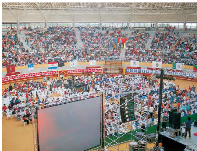
Este es el aspecto que presentaba la Plaza de Toros de Moralarzal momentos antes de iniciarse el espectáculo. Un impresionante montaje para un evento que congregó a unas 5.000 personas de diferentes pueblos serranos.

La fiesta del deporte serrano se celebró el viernes 2 de junio en la Plaza de Toros Cubierta de Moralarzal y contó con la asistencia de 5.000 invitados: deportistas, técnicos, responsables políticos y familiares de los cerca de 20.000 niños y jóvenes, entre 8 y 18 años, que este año han participado en las competiciones de ADS, que engloban los deportes de Ajedrez, Atletismo, Badminton, Gimnasia Rítmica y Deportiva, Judo, Karate, Natación, Tenis, Tenis de Mesa, Fútbol, Fútbol Sala, Voleibol y Campo a Través.