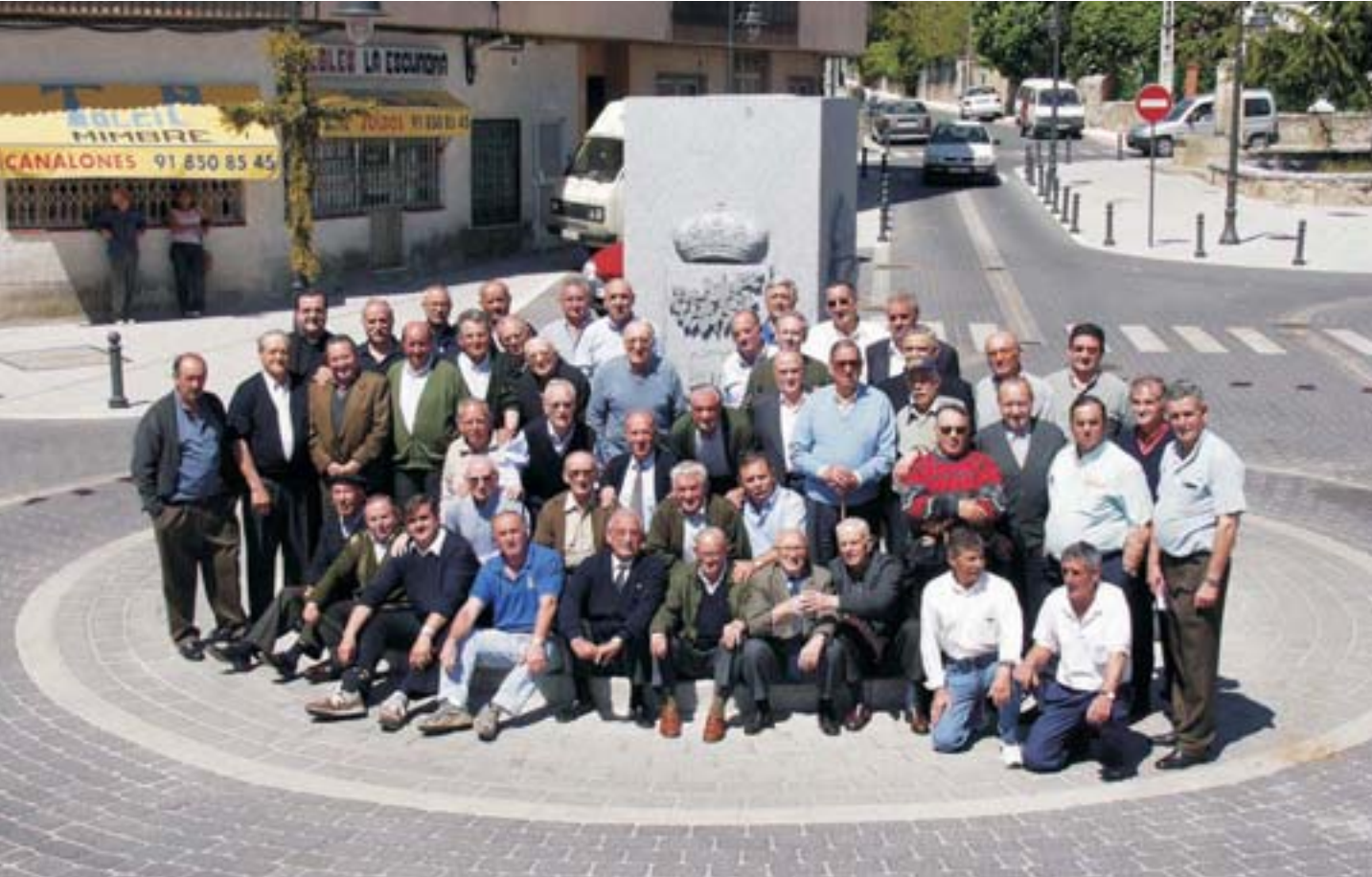
Los canteros de Moralzarzal posaban junto a su monumento el día 3 de mayo de 2003

nuestro municipio, cada uno de ellos en una fase del trabajo de talla de la piedra: una con el boceto inicial, otra en una fase intermedia y la otra con el escudo ya terminado.