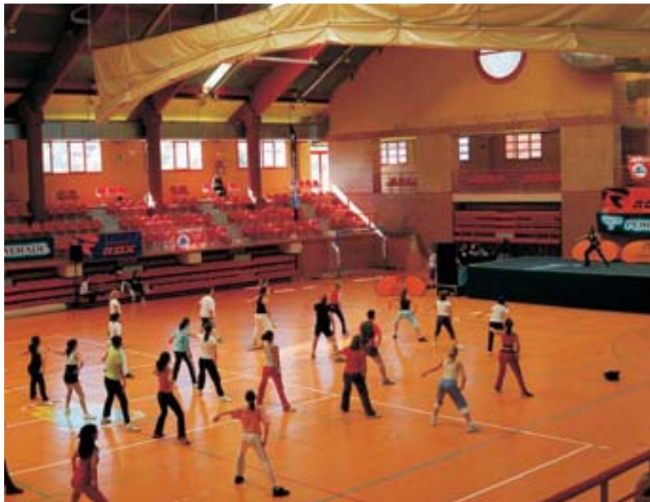
Se modificó la Ordenanza Fiscal sobre actividades deportivas

Aprobado. PP: a favor. PSOE: en contra. PDDM: en contra. IU: en contra.