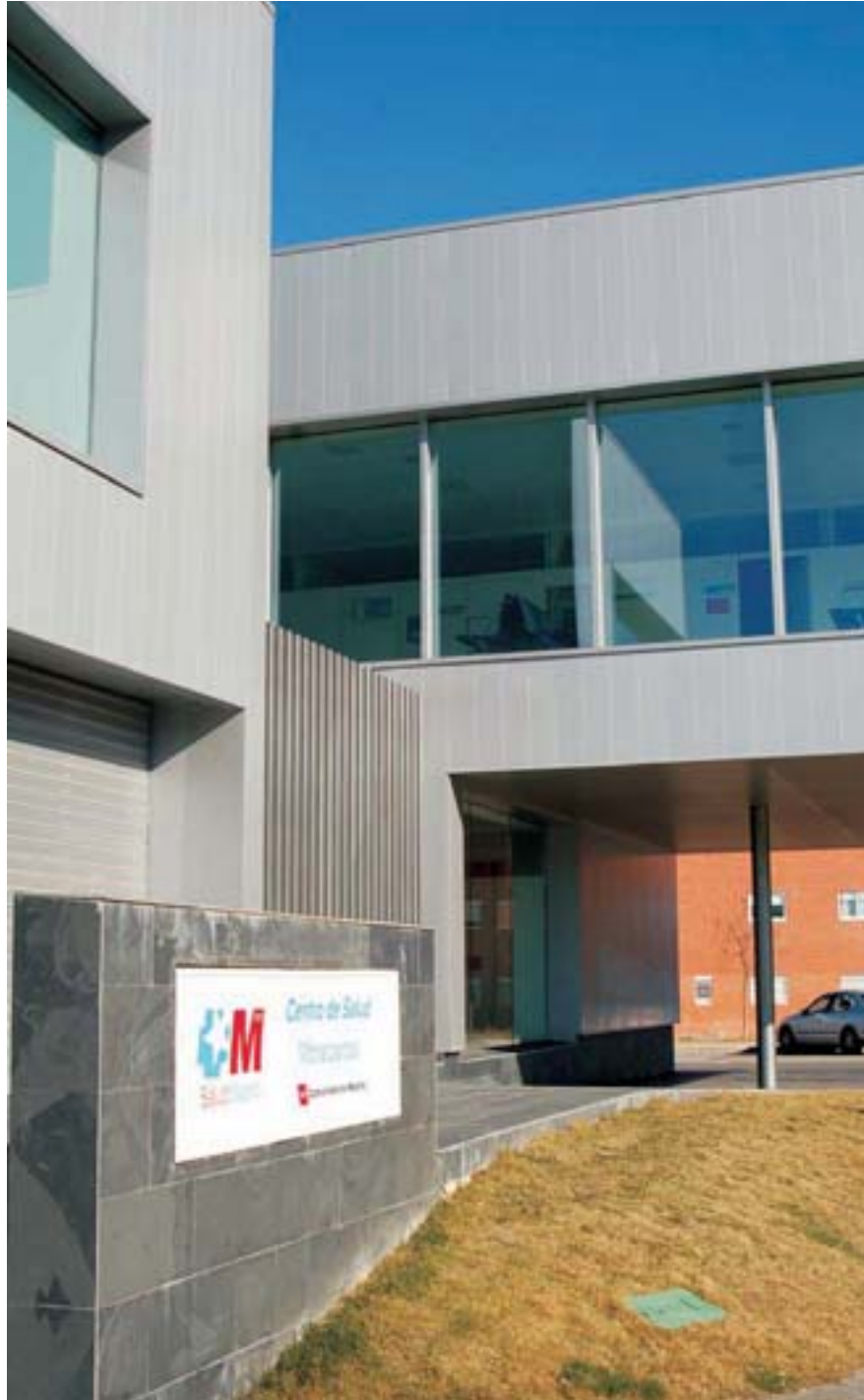
El Centro de Salud es uno de los más modernos de la Comunidad de Madrid

Concejalía de Sanidad. Lugar: Calle Antón, 40. Teléfono: 918577360.