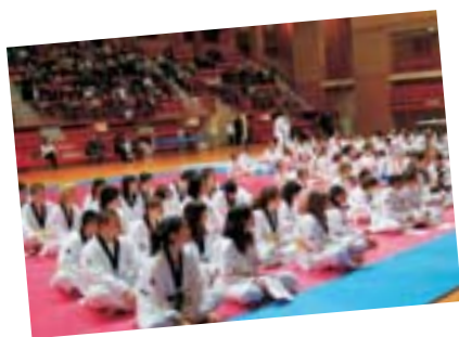
Festival de Entrega de diplomas