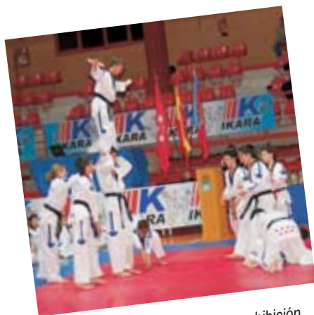
Un momento espectacular de la exhibición