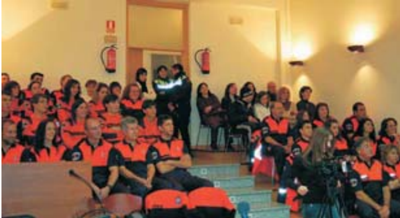
La Agrupación local colabora con los vecinos en todos los actos municipales

Protección Civil asesora a empresarios para casos de emergencias