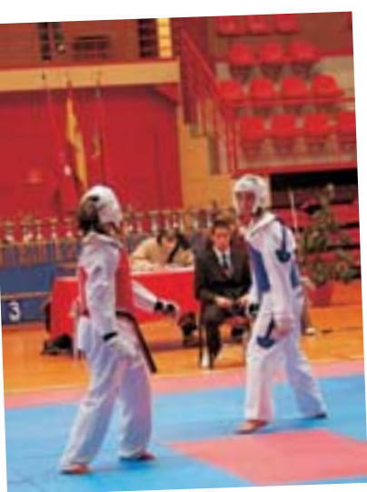
Campeonato de Madrid Junior