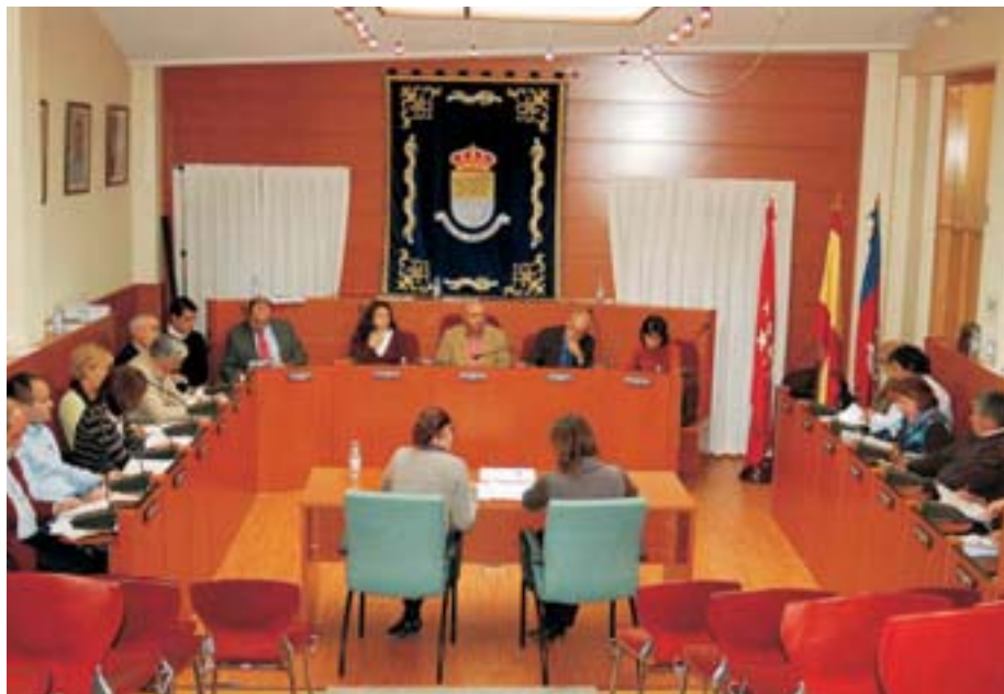
Imagen del Pleno Municipal

Aprobado. PP: a favor. PSOE: en contra. PDDM: en contra. IU: en contra.