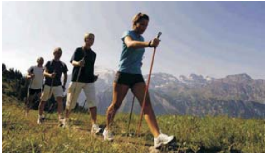
La actividad física puede prevenir la pérdida de masa ósea

Bailes de salón: el último viernes de mes, a las 19:30 horas.