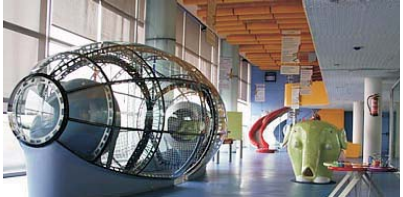
Visita a Cosmo-Caixa, un viaje alucinante por las estrellas, los sentidos, la ciencia...

Sólo tenéis que ir con vuestros instrumentos y podréis tocar junto a los demás vuestras versiones de los clásicos del rock, tocando todas las variantes. Recordad que podéis traer vuestros instrumentos tanto acústicos como eléctricos.