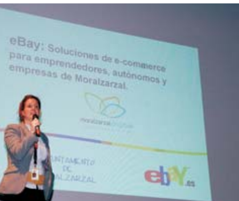
de las ventajas de vender a través de Ebay

y una empresa como Iguana Sell comenzará a vender los productos para la empresa interesada en Ebay, hasta que cada uno quiera empezar a vender por sí mismo. No se pierde nada, no se arriesga nada, sólo hay que probar con todas las facilidades al alcance de la mano.