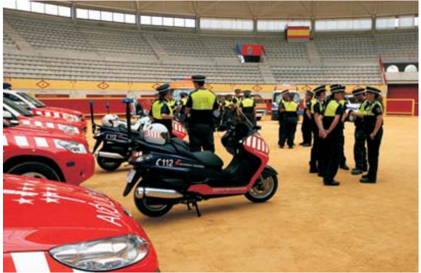
Los comerciantes participarán en el diseño de medidas preventivas de la Policía Local

Las personas interesadas en solicitar este servicio deben pedir cita previa en El Hogar (C/ Antón, 40. Tlf: 918577360).