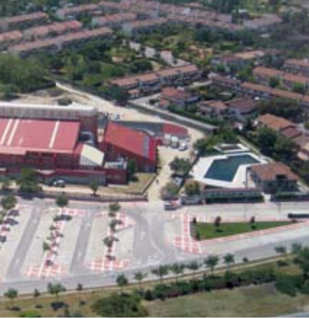
fotografiados desde el helicóptero policial