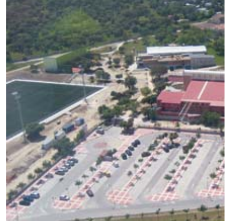
El polideportivo y el colegio San Miguel Arcángel,

El helicóptero está capacitado para toda clase de vuelos, incluyendo sobrevuelo de terrenos peligrosos y aterrizaje en plataformas elevadas (edificios altos), lo que permitirá a los agentes intervenir con totales garantías de éxito por complicada que sea la situación. Además, dispone de la posibilidad de incorporar