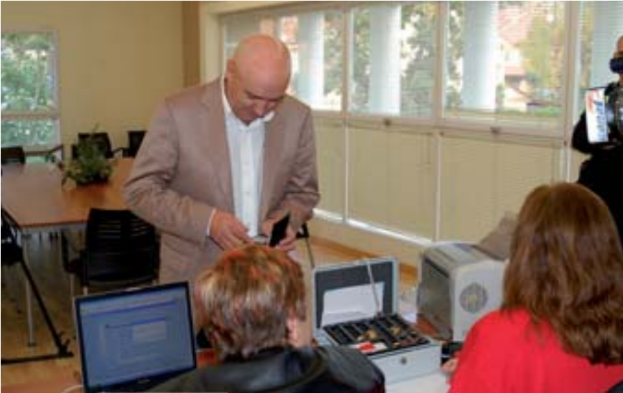
La Oficina de Tramitación del D.N.I. se encuentra en el Centro de Protección Ciudadana, Calle Raso, 11

El Centro de Protección Ciudadana de Moralarzal cuenta con un nuevo servicio desde el pasado 17 de octubre. Se trata de la Oficina de Tramitación del D.N.I., a través de la cual ya se puede gestionar tanto la expedición como la renovación del Documento