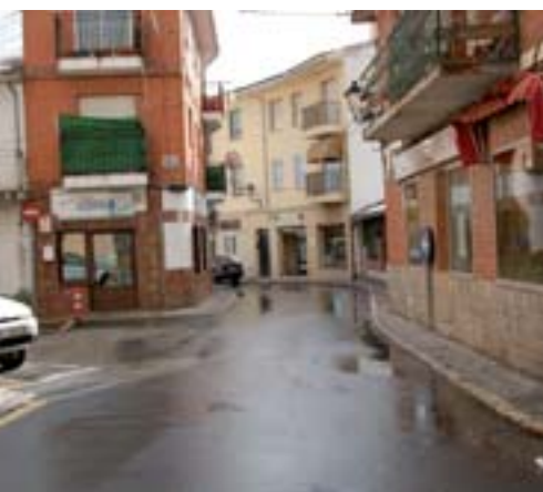
Calle de Peñuela