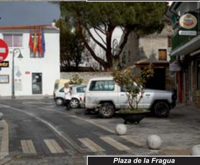
Plaza de la Fragua