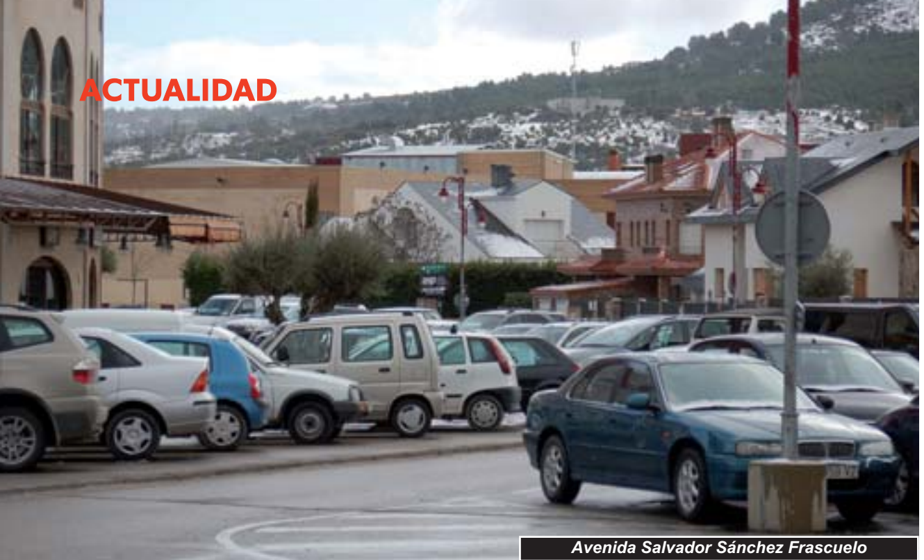
Avenida Salvador Sánchez Frascuelo