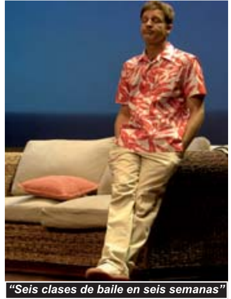
"Seis clases de baile en seis semanas"

Servicios Sociales. Entierro de la sardina. El Hogar. 18 h.