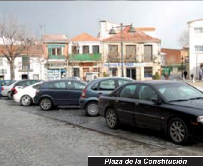
Plaza de la Constitución