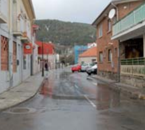
Calle de la Cruz