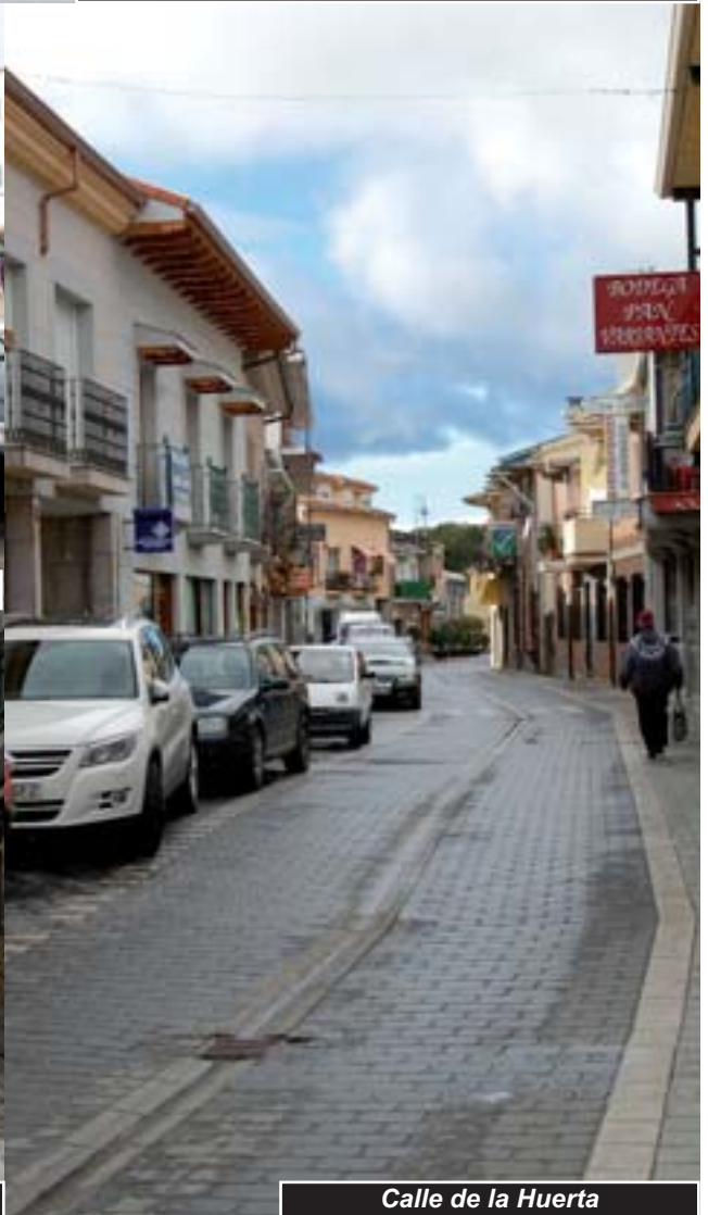
Calle de la Huerta