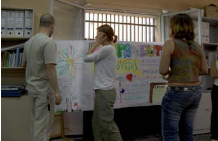
Varios Jóvenes, en la Casa de Juventud, durante una de las actividades que organizan

La Casa de Juventud sigue reclutando reporteros/as y redactores para incluirlos en el nuevo periódico juvenil. Reportajes, recetas, críticas de libros, películas, deportes. Todo tiene cabida.