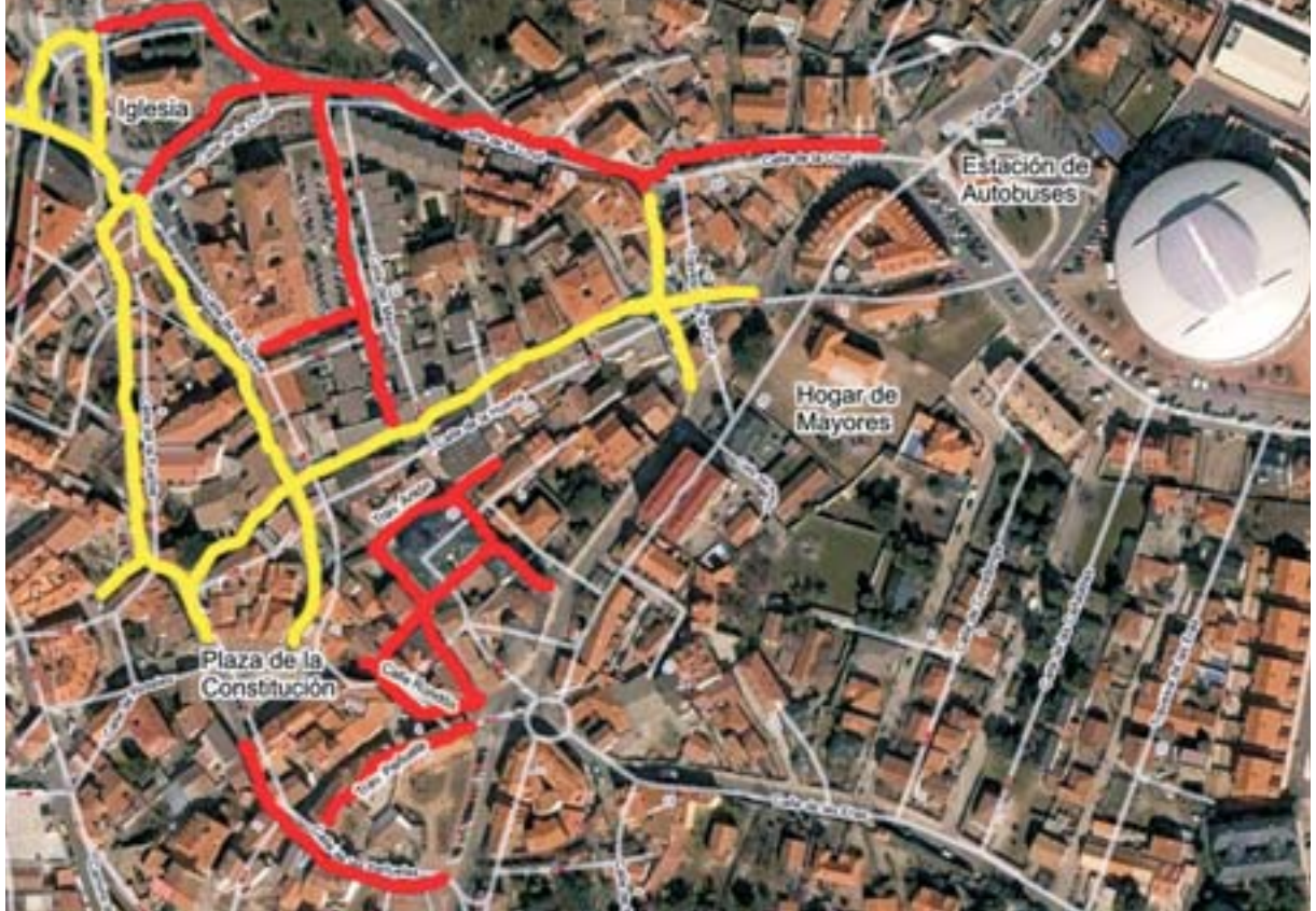
Calles incluidas en la Segunda Fase de remodelación del casco -marcadas en rojo- y calles de la primera fase -marcadas en amarillo-.

responden 1,9 millones del total de 1.076 que se destinarán a los consistorios madrileños. El mayor importe en la Comunidad de Madrid se lo llevará el Ayuntamiento de la capital, con un máximo de 554 millones, y el menor, Madarcos, con 7.900 euros.