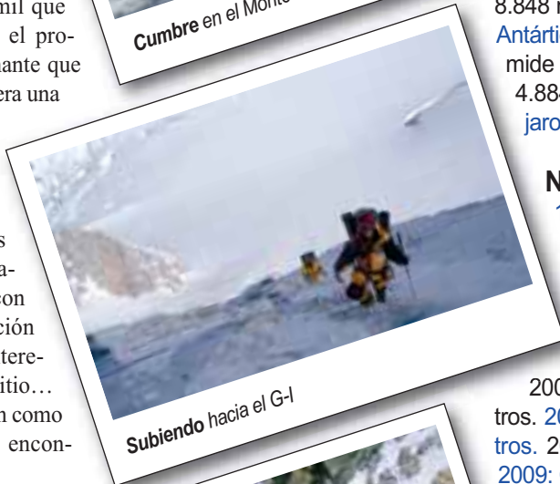
Subiendo hacia el G-I