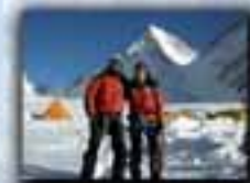
Gasherbrum I (8.068 metros) Año 2009