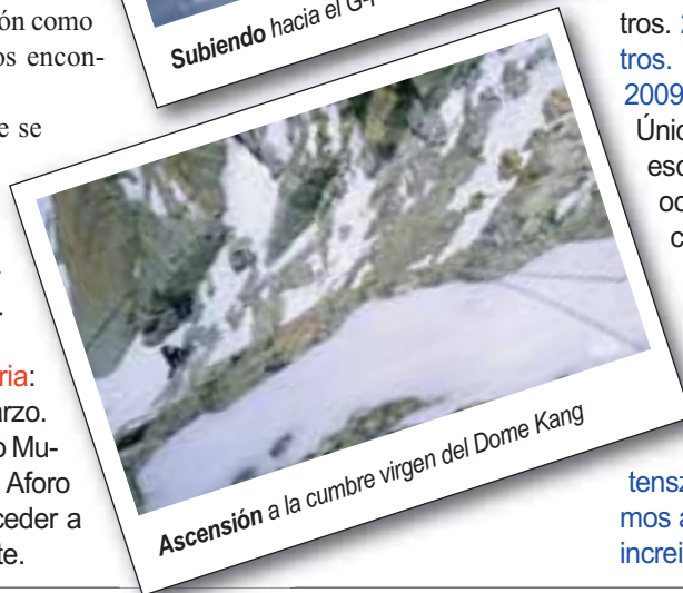
Ascensión a la cumbre virgen del Dome Kang