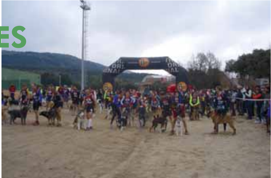
Salida de una de las pruebas de Canicross celebradas en la Ciudad Deportiva Navafria.

En cuanto a resultados, aunque son secundarios en nuestras escuelas, nos gustaría destacar que la mayoría de nuestros equipos se encuentran muy bien situados en sus respectivos grupos y desplegando un buen juego en el que predomina el grupo sobre las individualidades.