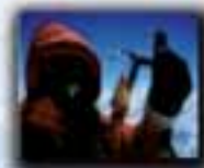
Everest (8.848 metros) Año 2001