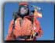
Makalu (8.463 metros) Año 2008