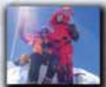
Sisha Pagma (8.027 metros) Año 2005