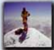
Gasherbrum II (8.035 metros) Año 1994