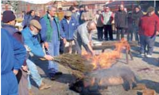
Socarrado, luego raspado, afeitado y lavado del animal.