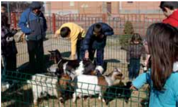
En el Parque se colocan corralitos con animales de granja.