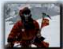
Broad Peak (8.047 metros) Año 2007