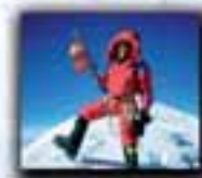
K2 (8.611 metros) Año 2004