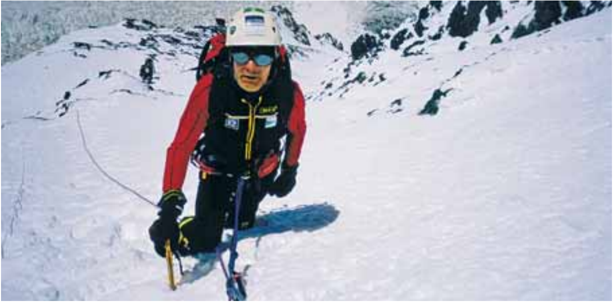
Carlos Soria subiendo el K2 en 2004. Es el alpinista de todo el mundo que lo ha conseguido con más edad.

Único en el mundo en lograr el reto “7 cumbres, 7 continentes a los 70 años”, nos contará sus últimas hazañas el sábado, 13 marzo, a las 20,00 h. en el Centro Cultural