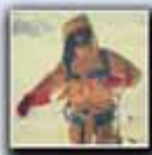
Mangu Parbat (8.125 metros) Año 1990