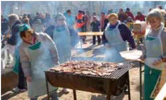
Pequeño aperitivo de productos de matanza el sábado y el domingo.