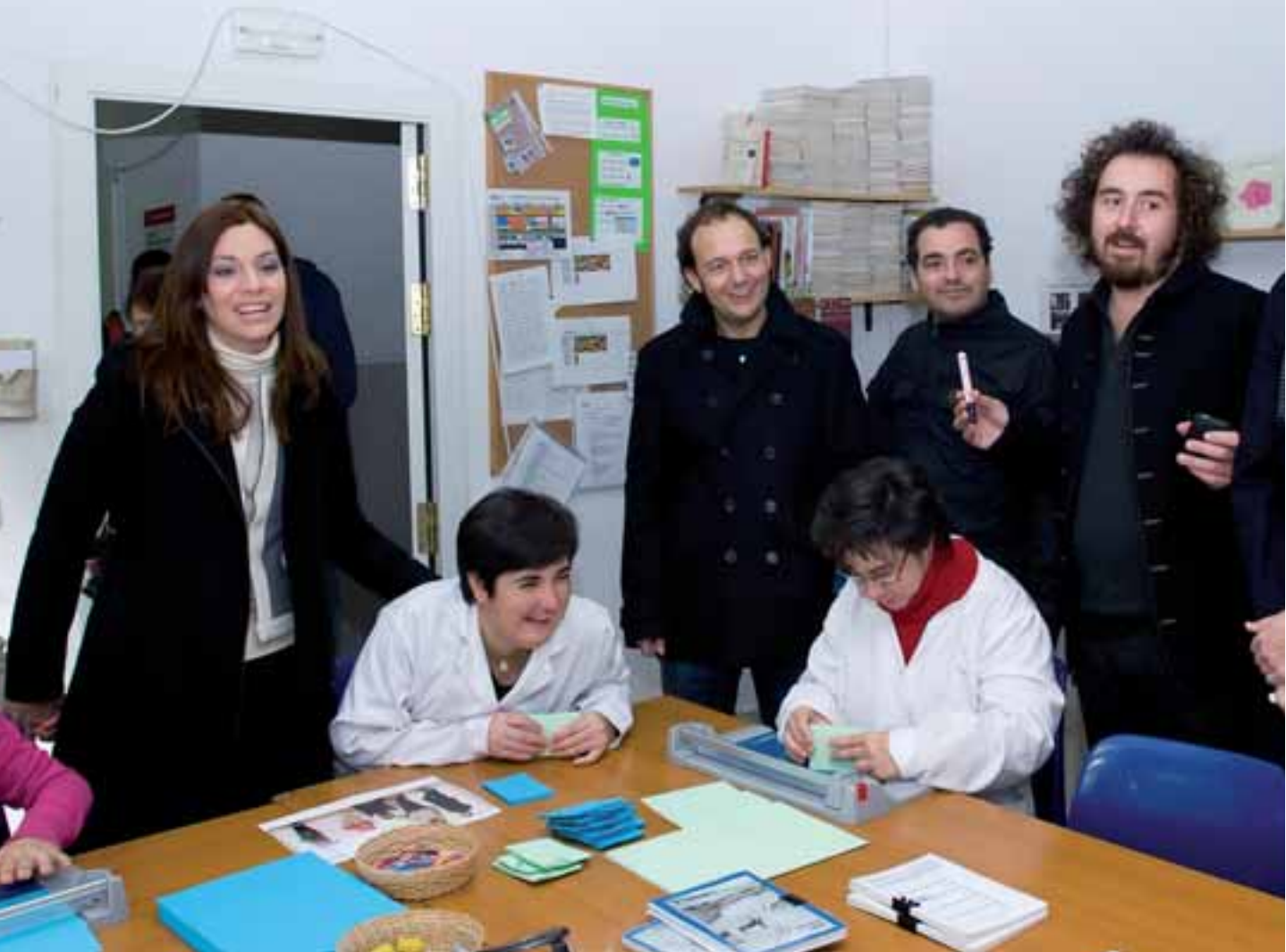
Los componentes del grupo, durante su visita a Apascovi, el pasado 3 de diciembre de 2009

Concierto benéfico a favor de la Fundación Apascovi, el sábado, 6 de marzo, a partir de las 21,00 horas