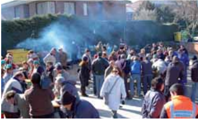
La colaboración de los vecinos es imprescindible en la celebración.