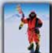
Cho Oyu (8.201 metros) Año 1999