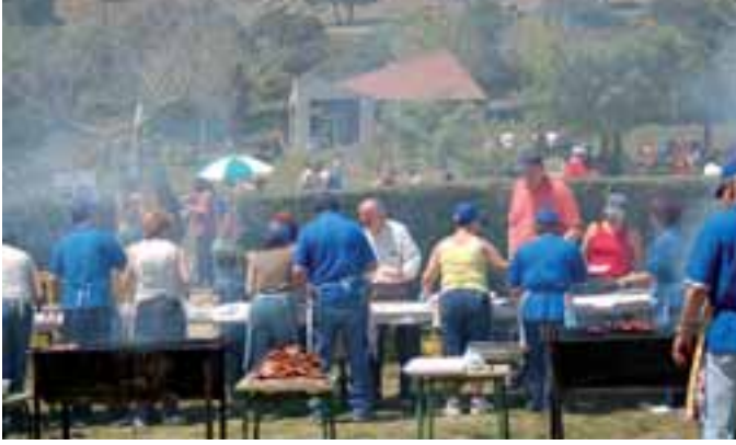
Como siempre, los vecinos hacen posible que la tradición continúe.