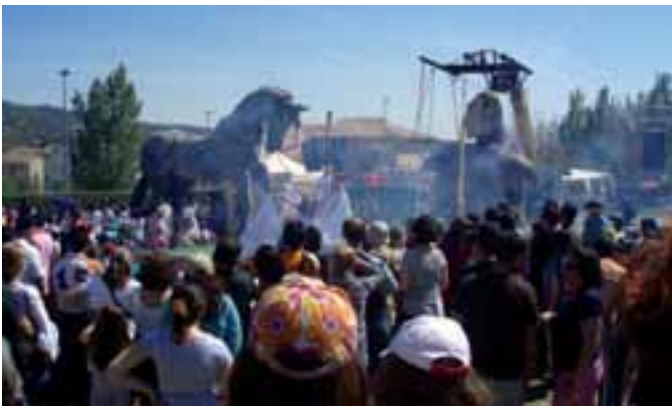
Las actividades para niños son las protagonistas de la tarde.