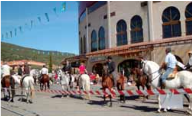
Romería de caballos por las calles de la localidad.