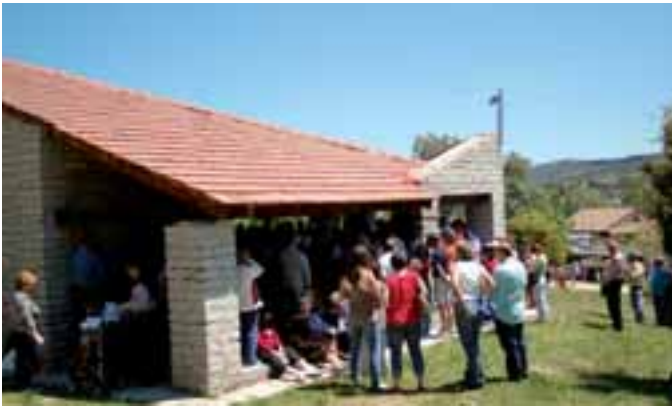
Misa, en la Ermita del parque de La Tejera.