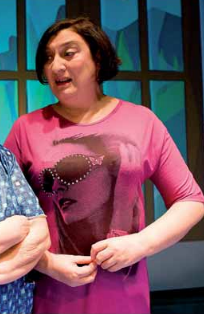
una forma de vida que no soportan, protagonizan "Fugadas".

haciendo un alegre picnic en un cementerio o pasando una noche en un cuartelillo de la policía.