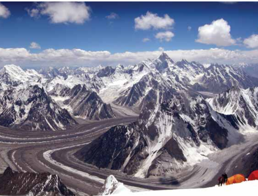
Fotografía ganadora en 2008, "El Karakorum a sus pies", de Sito Carcavilla.

euros. El jurado, compuesto por especialistas en la materia, hará una primera selección de cuarenta fotografías como máximo. Se celebrará una exposición con las obras seleccionadas en