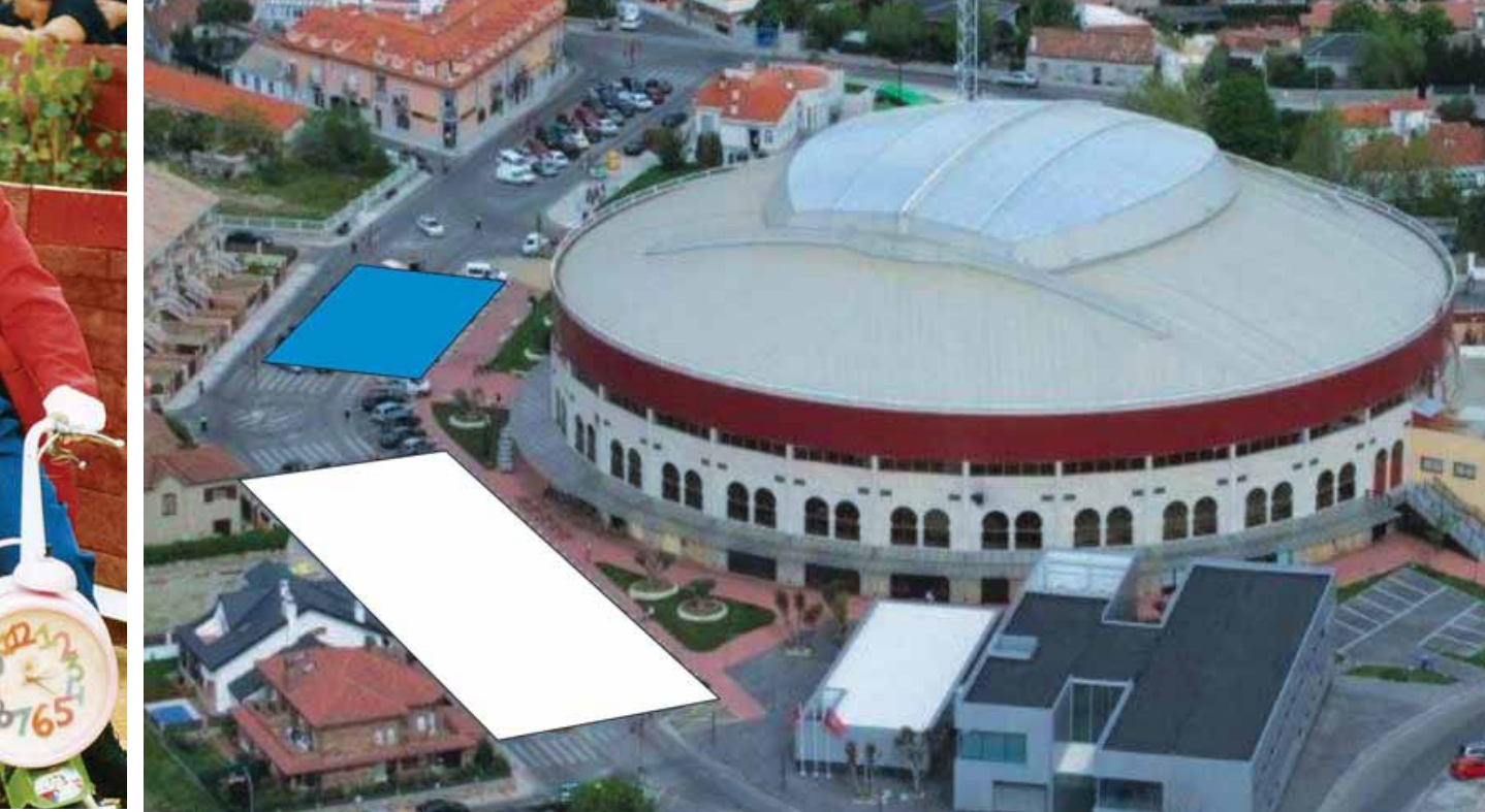
Se volverán a instalar dos grandes carpas en la Avenida Salvador Sánchez Frascuelo.

de la Plaza de Toros y la Avenida Salvador Sánchez Frascuelo.