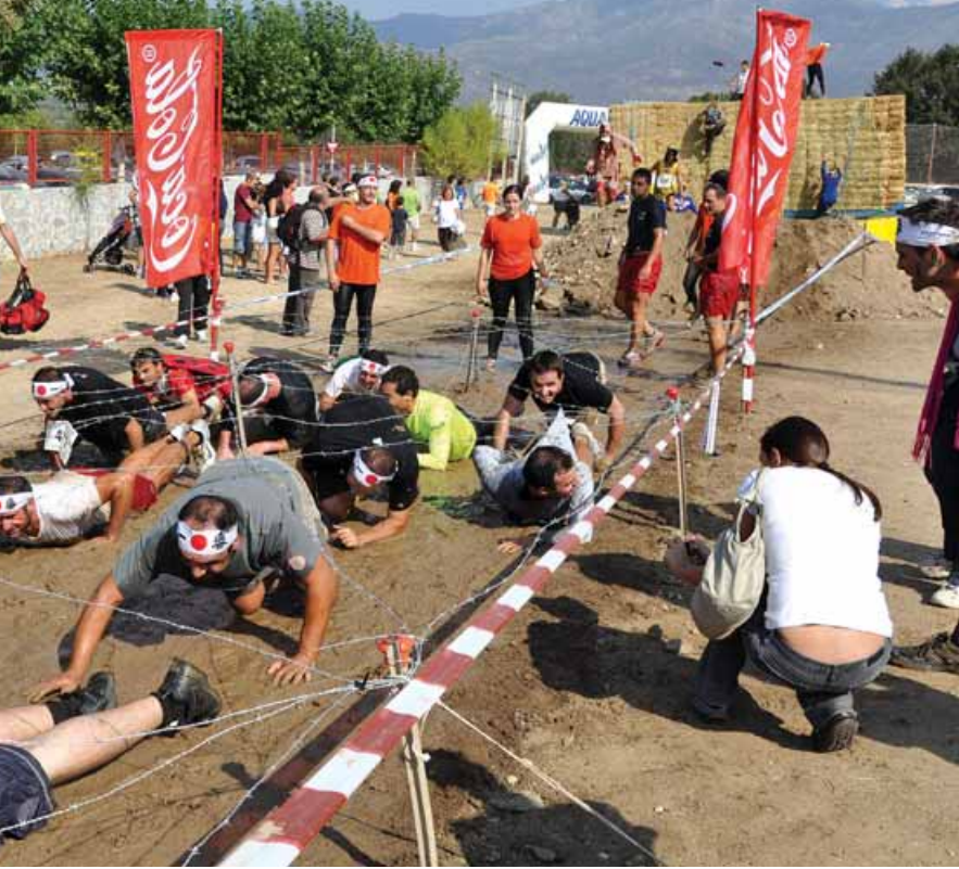
Gatear bajo alambres de espino, antes de entrar en la meta.