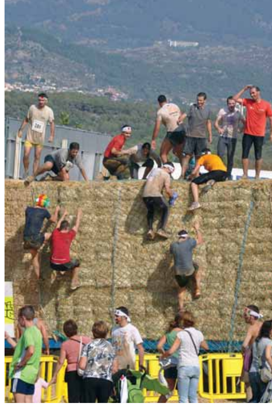
Y cruzar montañas, aunque sean de paja.

brándose, está destinada para cualquier tipo de persona mayor de 15 años, ya que hay tres horas para terminar la misma.