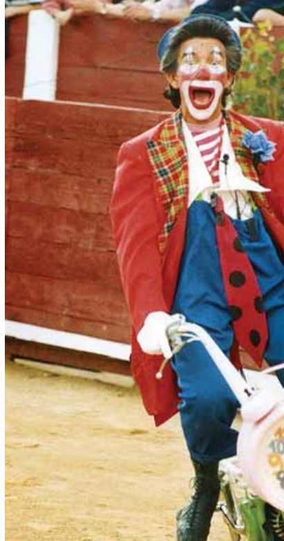
Encierros infantiles, el sábado. "Popeye torero", espectáculo cómico taurino.

Misma estructura y misma reducción del presupuesto