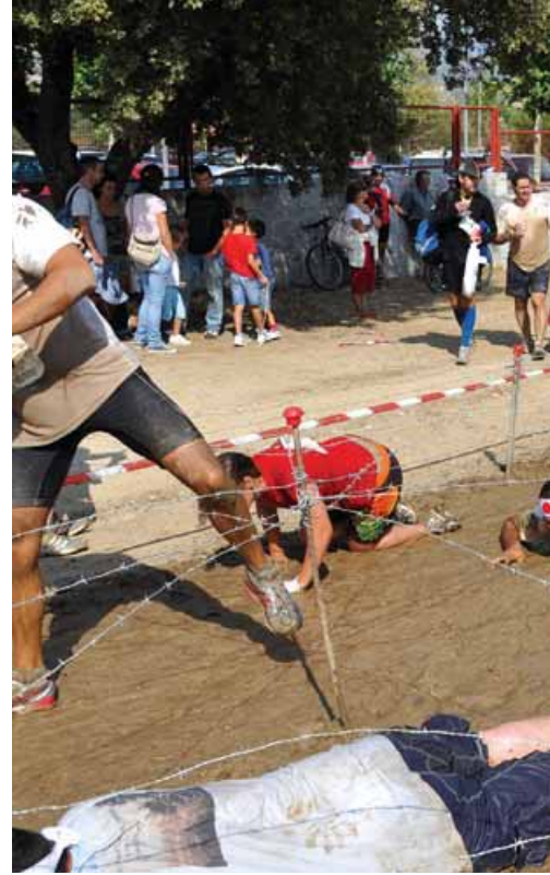
Disfraces y barro forman parte del espectáculo de la competición

El domingo, 12 de septiembre, vuelve una prueba deportiva muy especial, con diez kilómetros en los que los disfraces, el barro y los numerosos obstáculos son protagonistas