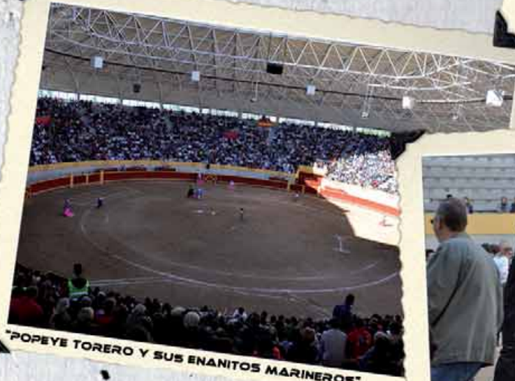
"POPEYE TORERO Y SUS ENANITOS MARINEROS"