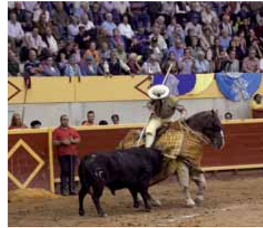
Imágenes de la Feria 2010, un rotundo éxito.

ralzarzal. Aforo: 6.029. Feria de Novilladas con Picadores 2010.