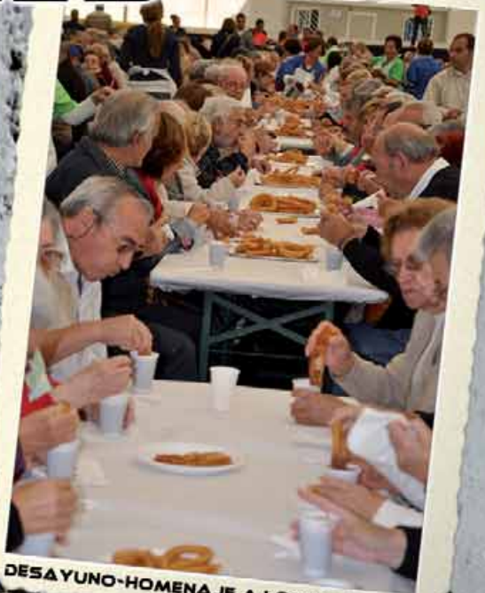
DESAYUNO-HOMENAJE A LOS MAYORES