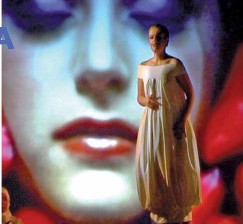
Carmina Burana, todo un espectáculo visual. A la derecha, imagen de "Subiendo al Sur".

Por otro lado, se ha renovado la imagen de la Biblioteca, pintando y renovando el interior de la misma, con especial hincapié en la sección infantil, que cuenta con una decoración especial.