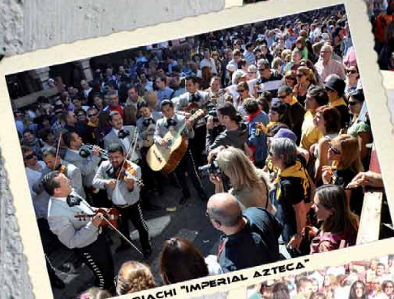
GRUPO MARIACHI "IMPERIAL AZTECA"