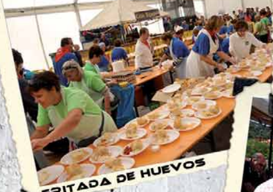
FRITADA DE HUEVOS