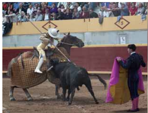
Mejor ganadería, La Guadamilla