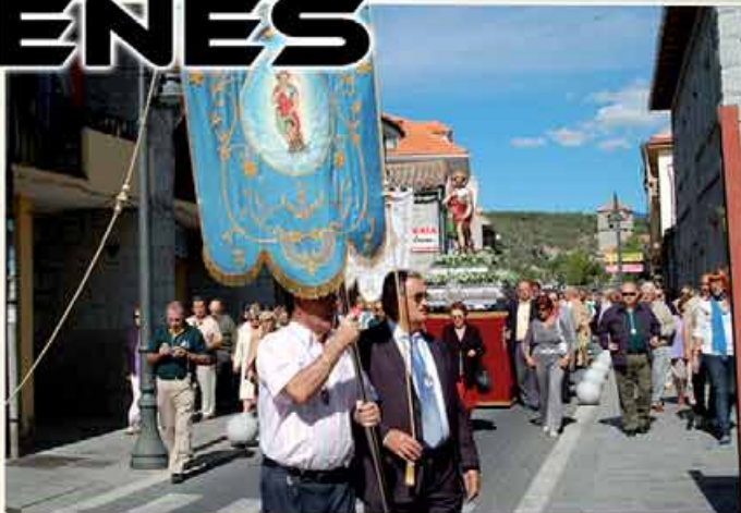
PROCESION DE SAN MIGUEL ARCANGEL