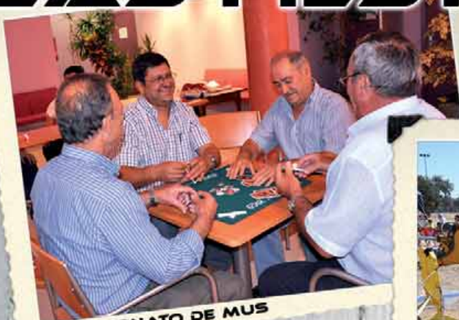
CAMPEONATO DE MUS