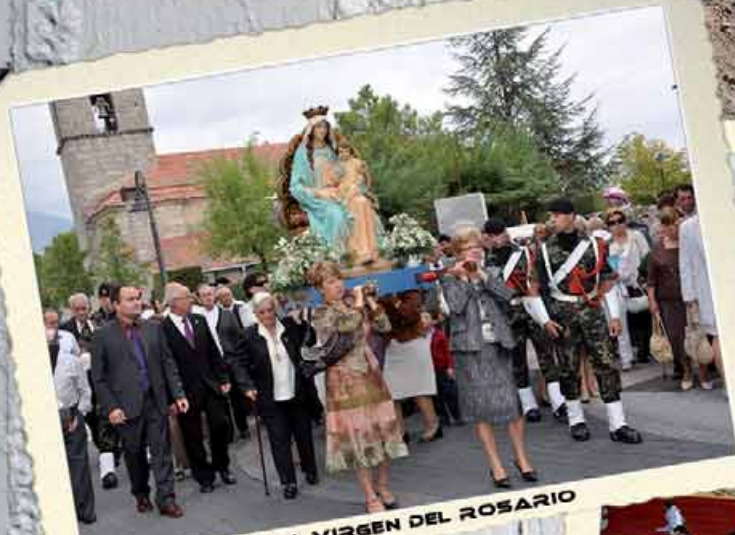
PROCESION DE LA VIRGEN DEL ROSARIO