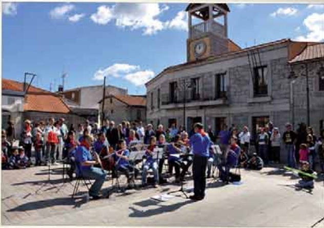
CONCIERTO DE LA BANDA MUNICIPAL