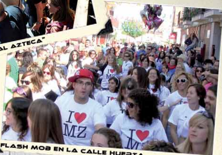
FLASH MOB EN LA CALLE HUERTA