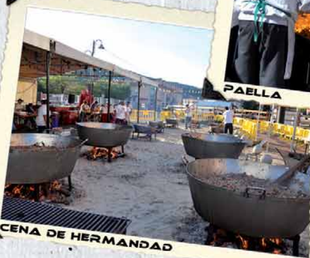
CENA DE HERMANDAD