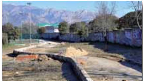
Adecuación del Circuito de Cross. Al circuito de cross que rodea la Ciudad Deportiva se le ponen bordillos y se mejora en todo su recorrido.

El Ayuntamiento lleva a cabo obras de acondicionamiento y mejora en la Ciudad Deportiva Navafría, que se recogen en el siguiente plano. Los trabajadores empleados son subvencionados por la Dirección General de Empleo de la Comunidad de Madrid y el INEM.