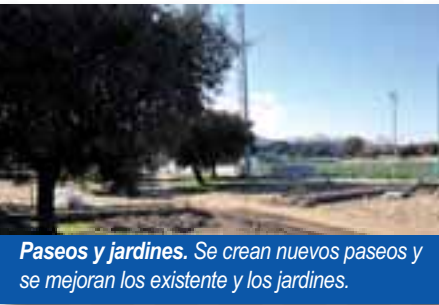
Paseos y jardines. Se crean nuevos paseos y se mejoran los existentes y los jardines.