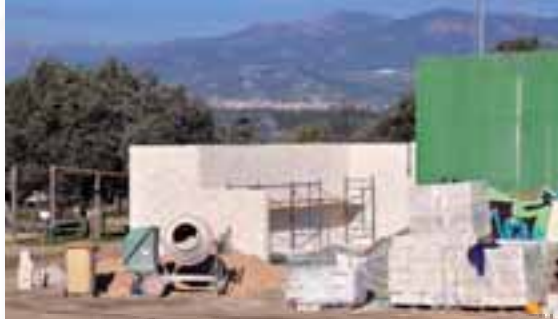
Dos nuevas pistas de pádel. Dos de los tres mini frontones se transforman en pistas de pádel, uno de los deportes con mayor demanda de usuarios.