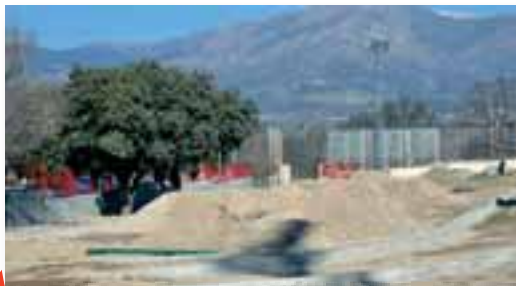
Zona de usos múltiples y aparcamiento, que será utilizado según las necesidades de los eventos que se celebren en la ciudad Deportiva.