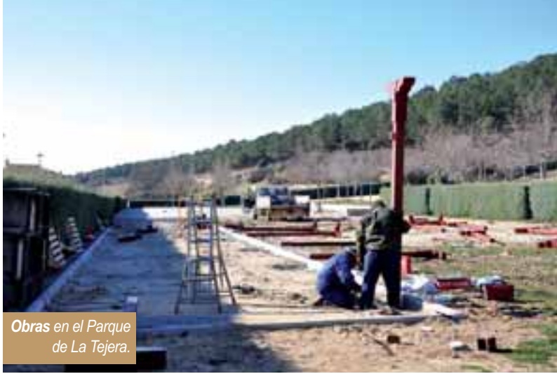
Obras en el Parque de La Tejera.