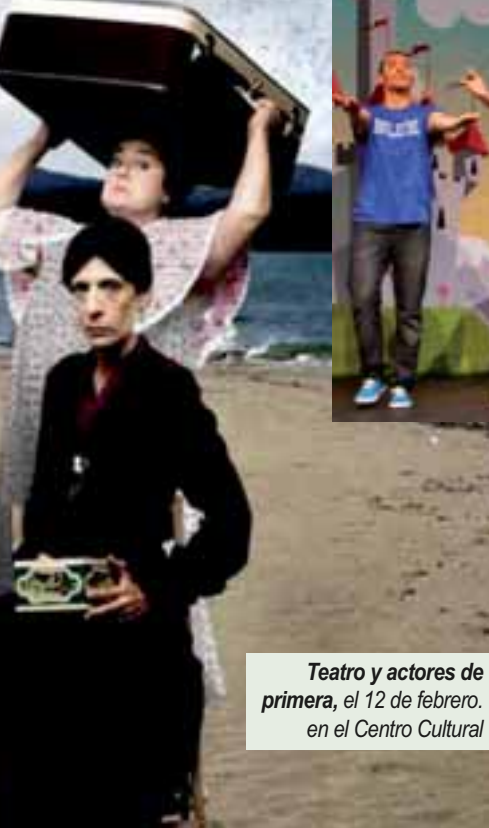
Teatro y actores de primera , el 12 de febrero. en el Centro Cultural