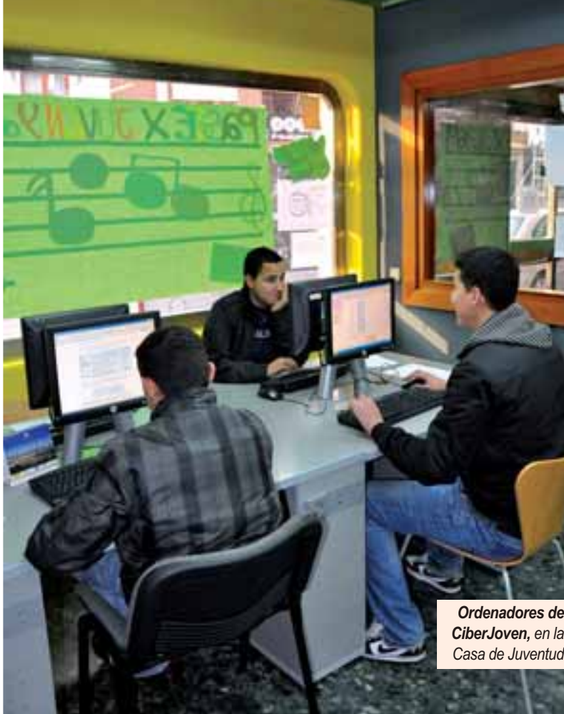
Ordenadores de CiberJoven, en la Casa de Juventud