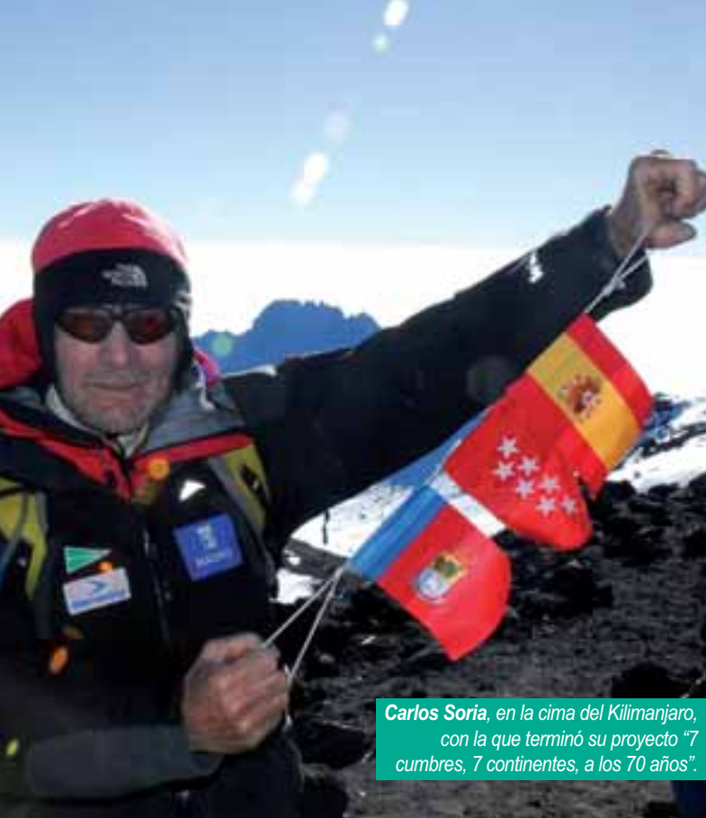
Carlos Soria , en la cima del Kilimanjaro, con la que terminó su proyecto "7 cumbres, 7 continentes, a los 70 años".

Toda una vida dedicada al alpinismo de élite, admirado y respetado por los que conocen bien el mundo de la montaña, es ahora, en su edad de oro, cuando se convierte en el centro de todas las miradas y en un fenómeno mediático.