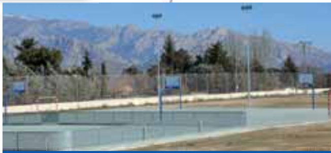
Nuevas pistas polideportivas. Ya están terminadas las dos nuevas pistas polideportivas al aire libre. Baloncesto, balonmano, fútbol sala... y una de ellas dedicada a patinaje.