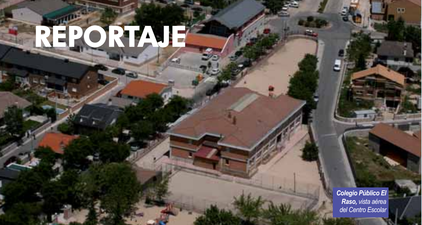
Colegio Público El Raso, vista aérea del Centro Escolar