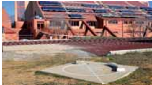
Zona de lanzamiento de Atletismo. Esta zona, situada junto a la pista de atletismo, será remodelada.