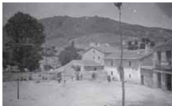
En la Plaza, la diligencia que traía el correo desde Villalba a principios del siglo XX. Nuestro equipo de fútbol, anterior a los años 40, y nuestra Plaza, con sus tradicionales "gradas"

La Exposición y el libro estarán listos esta primavera