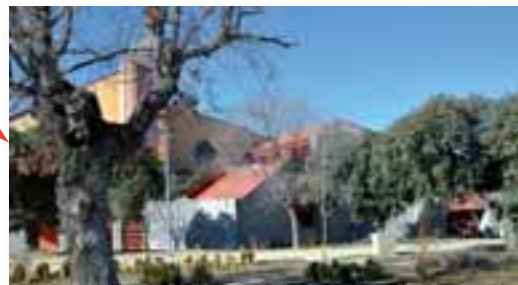
Pintura en el Pabellón. Van a ser pintadas algunas zonas del Pabellón Cubierto.