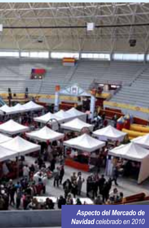
Aspecto del Mercado de Navidad celebrado en 2010