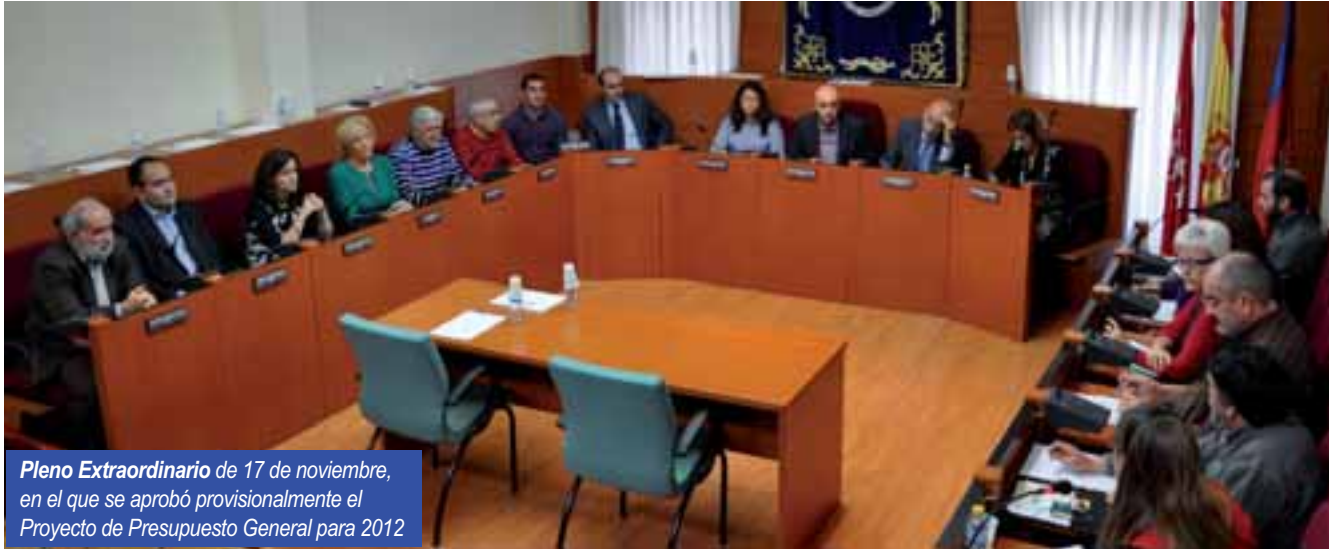
Pleno Extraordinario de 17 de noviembre, en el que se aprobó provisionalmente el Proyecto de Presupuesto General para 2012

El Pleno aprueba inicialmente el Proyecto de Presupuesto del Ayuntamiento para 2012