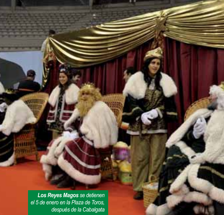
Los Reyes Magos se detienen el 5 de enero en la Plaza de Toros, después de la Cabalgata