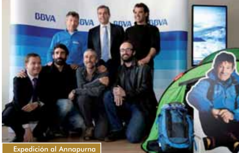
Expedición al Annapurna

Nuestro vecino partió hacia Nepal el día 5 de marzo