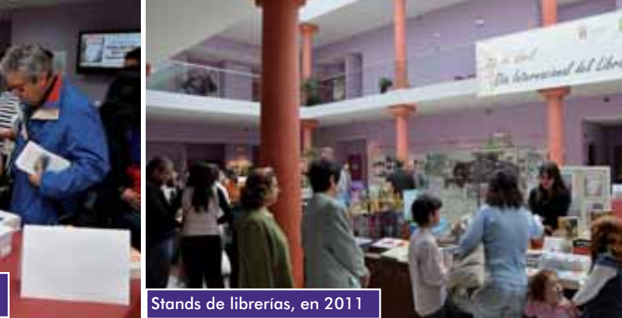
Stands de librerías, en 2011