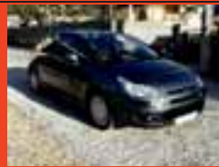
CITROËN C4 HDI AÑO 2006 86.000 Km 5.950 €

EN BECERRIL DE LA SIERRA AV. DE JOSE ANTONIO, 108