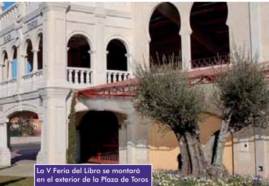
La V Feria del Libro se montará en el exterior de la Plaza de Toros

la Biblioteca Municipal, con la acogida de visitas escolares durante la mañana, y por la tarde nos sumaremos a la iniciativa "La noche de los Libros" que organiza la Comunidad de Madrid y en la que participa la Biblioteca a través de la representación "El tesoro de los Grimm", por el grupo La Tortuga Veloz, en la sala infantil a las 18,00 horas.