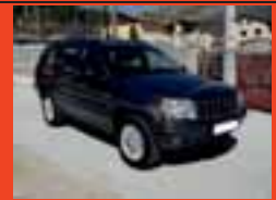
JEEP GRAND CHEROKEE 2.7 CRD AÑO 2002 220.000 Km 7.200 €