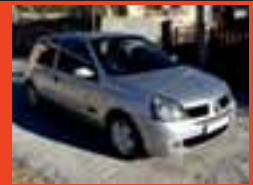
RENAULT CLIO DCI AÑO 2005 140.000 Km 3.600 €