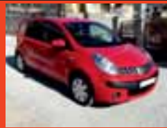
NISSAN NOTE DCI AÑO 2007 110.000 Km 5.800 €