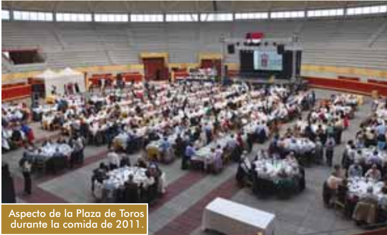
Aspecto de la Plaza de Toros durante la comida de 2011.

La tradicional comida homenaje que la Concejalía de Servicios Sociales del Ayuntamiento de Moralzarzal ofrece a sus mayores tendrá lugar el jueves, 26 de abril, en la Plaza de Toros Cubierta. Pueden asistir todas las