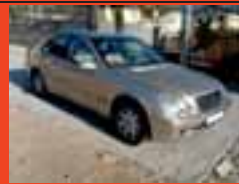
MERCEDES C180K AÑO 2002 115.000 Km 6.700 €