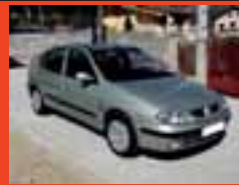
RENAULT MEGANE 1.6 16V AÑO 2002 136.000 Km 2.600 €