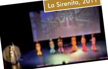
La Sirenita, 2011

ADESGAM -Asociación a la que pertenece Moralarzal- ha llegado a un acuerdo con el balneario El Bosque, ubicado en Mataelpino, por el que se ofrece a nuestros vecinos la posibilidad de disfrutar de las instalaciones de este complejo, con un descuento del 40% de lunes a jueves -festivos no incluidos- y domingo por la tarde. El circuito hidrotermal, una vez aplicado el descuento, queda en 18 euros.