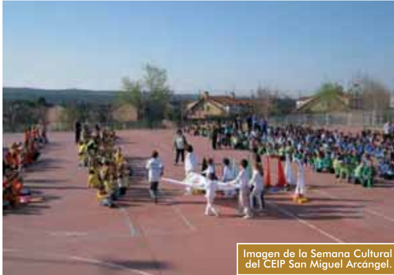
Imagen de la Semana Cultural del CEIP San Miguel Arcángel.

Onda da Vinci, 104.0 FM. ondadavinci.blogspot.com