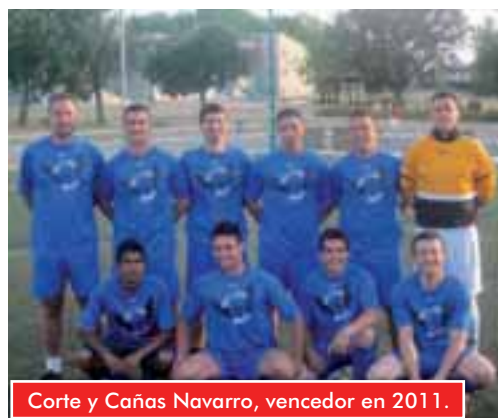
Corte y Cañas Navarro, vencedor en 2011.

El plazo de inscripción se abre el 7 de mayo y se cierra el 13 de junio. Deben formalizarse en la Ciudad Deportiva Navafría.