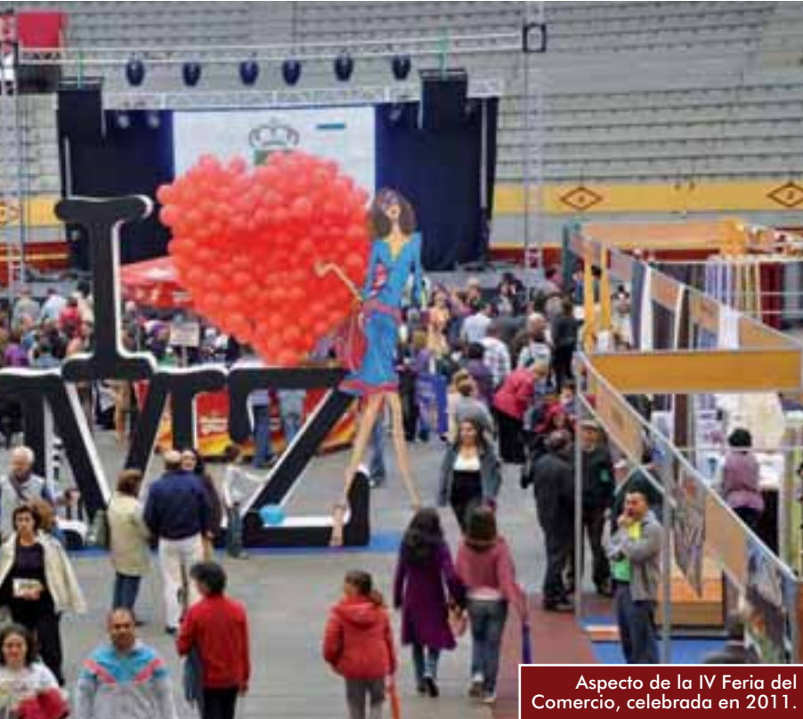
Aspecto de la IV Feria del Comercio, celebrada en 2011.