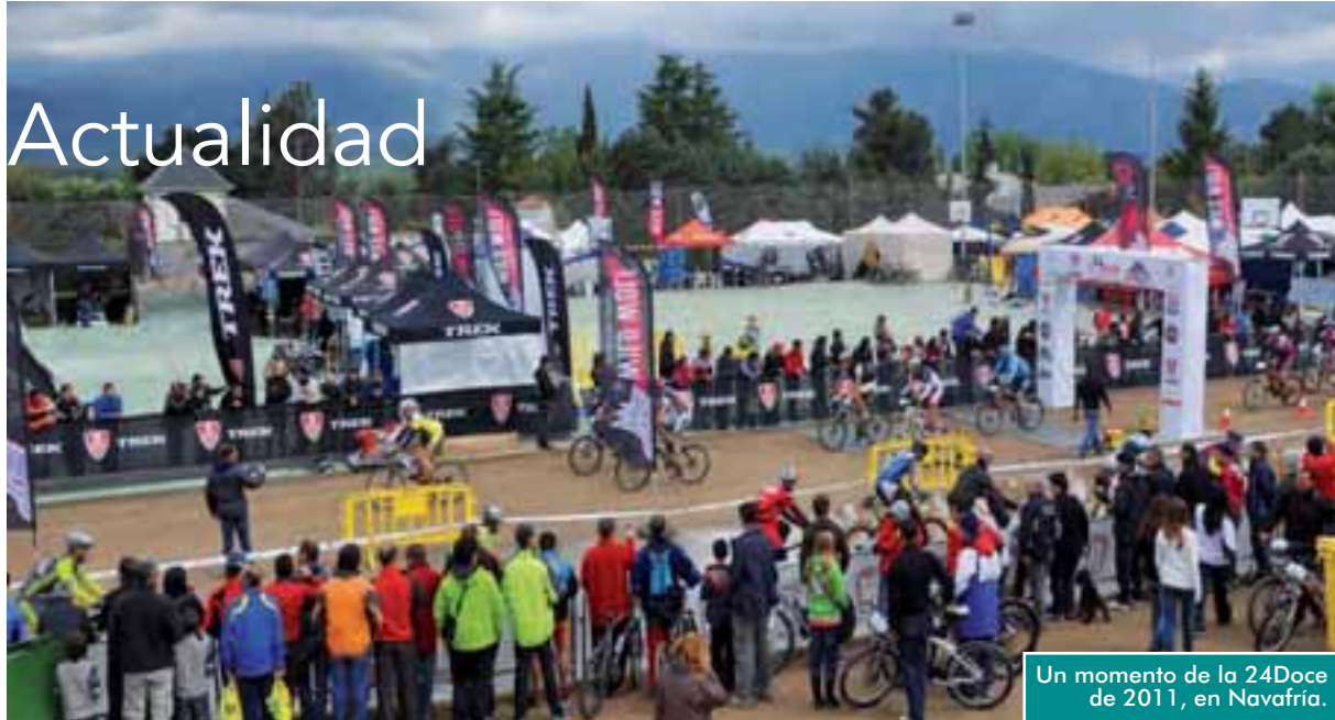
Un momento de la 24Doce de 2011, en Navafría.

Una cita obligada en Moralarzal, los días 30 de junio y 1 de julio