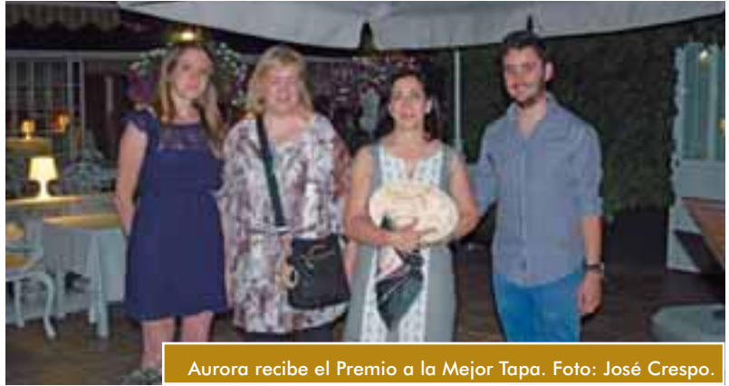
Aurora recibe el Premio a la Mejor Tapa.

En www.moralzarzal.es , les daremos a conocer con antelación los principales puntos de control: M-615, Avda. de la Salud, calle Antón, Vía del Berrocal, proximidades de centros escolares, etc.