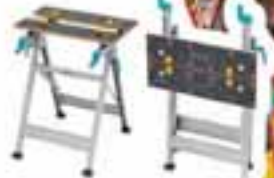
Mesas de trabajo