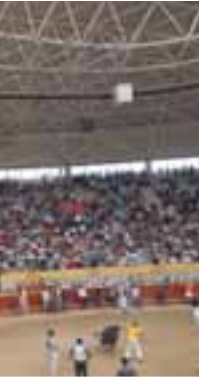
en los encierros.