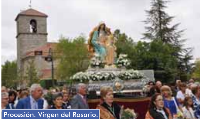
Procesión. Virgen del Rosario.