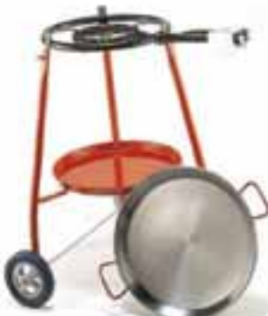
Sistema portátil de Paellas