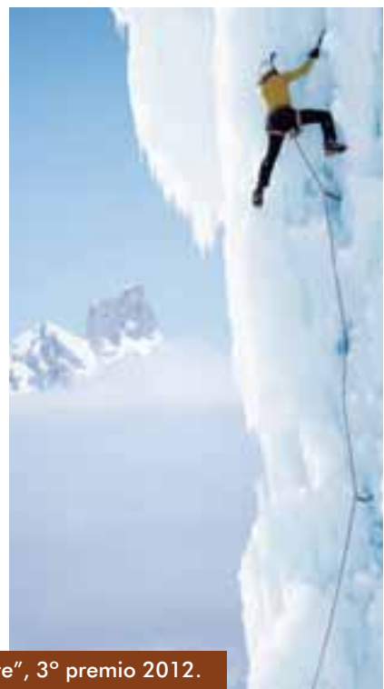
Concurso de Fotografía de Montaña. "Al límite", 3º premio 2012.