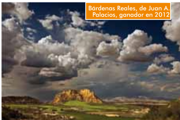
Bárdenas Reales, de Juan A. Palacios, ganador en 2012

zará el 1 de octubre y finalizará el 13 de noviembre. Se celebrará una exposición con las obras seleccionadas en el Centro Cultural de Moralarzal, durante la celebración de las Jornadas de Montaña, donde, en un acto social, se hará público el fallo del jurado el viernes, 22 de noviembre.