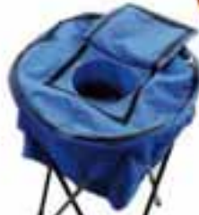
Nevera Portátil Plegable 19,95 €