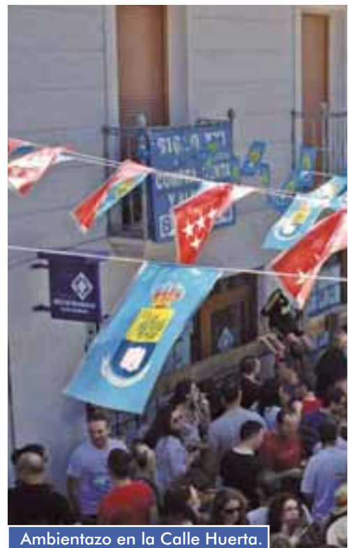
Ambientazo en la Calle Huerta.

Apache, que cuenta con muchos seguidores en la comarca.